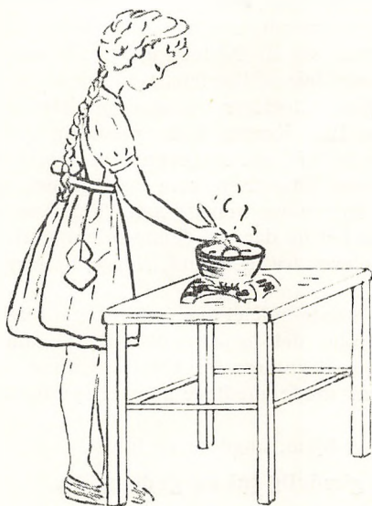
Gudrun Bollerups illustration til »min egen kogebog«

I skolekøkkenundervisningen har der i sommer deltaget 60 børn fra omegnskommunerne fordelt på 3 hold, i vinter er der 25 børn fordelt på 2 hold.