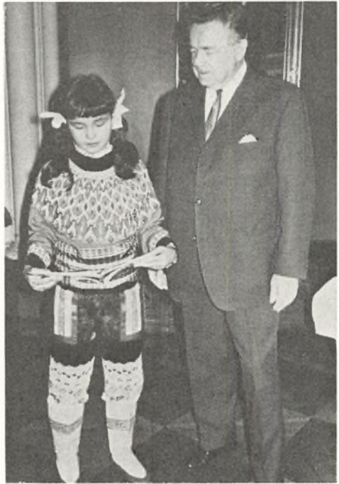
Fra besøget på Rådhuset hos Borgmesteren.