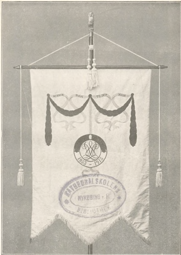
St. Knuds Gymnasium ∴ Odense (L. Winteler's Skole)