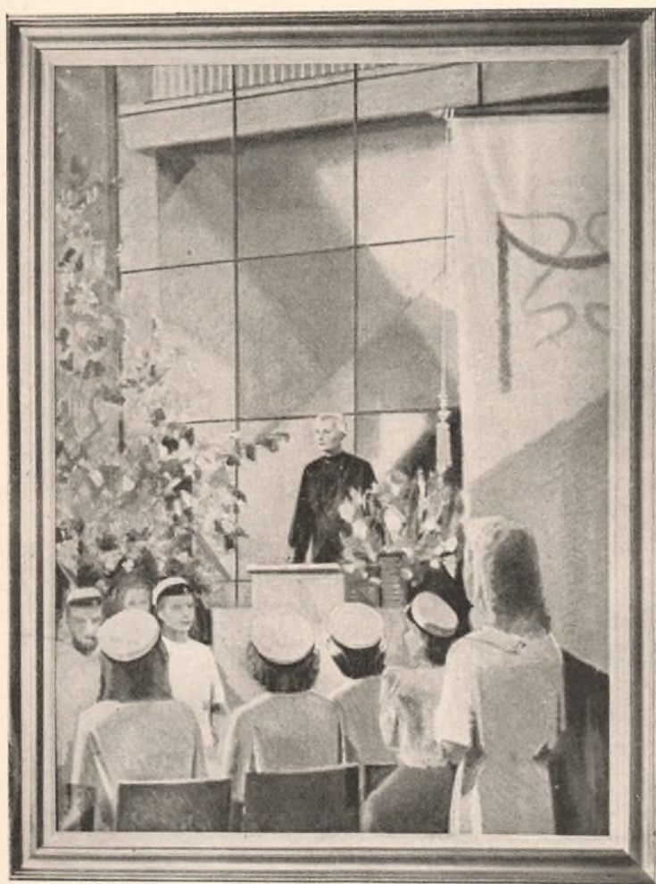
St. Knuds Gymnasium 15. 8. 1940.

Hjertelig Tak til Bidragerne for den smukke Gave. Den overskydende Sums Renter vil blive brugt til Flidspræmier ved Aarsafslutningen.