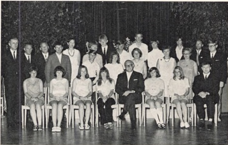
Fladstrand skole, 10.A 1970