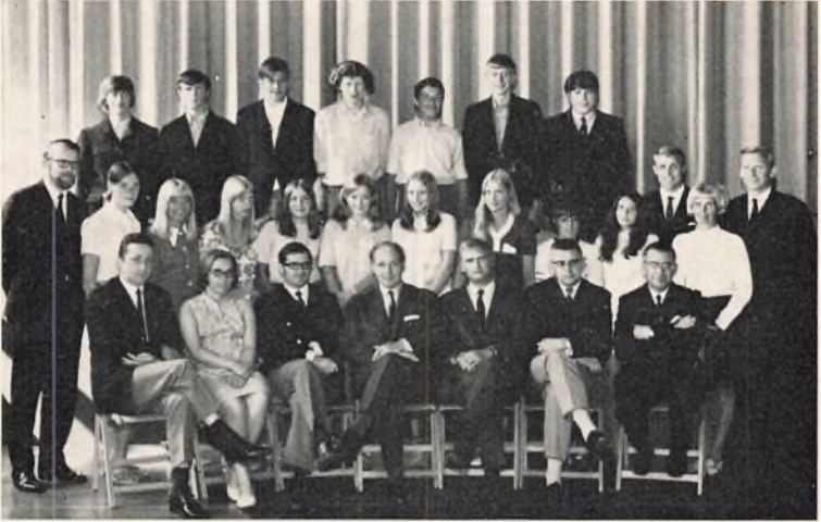
Bangsbostrand skole, 3. real b 1970