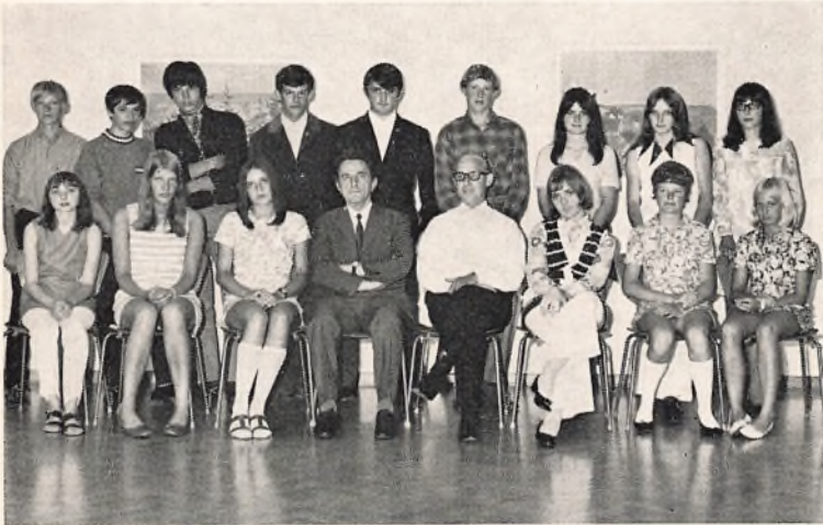
Ravnsbøj skole, 9. klasse 1970