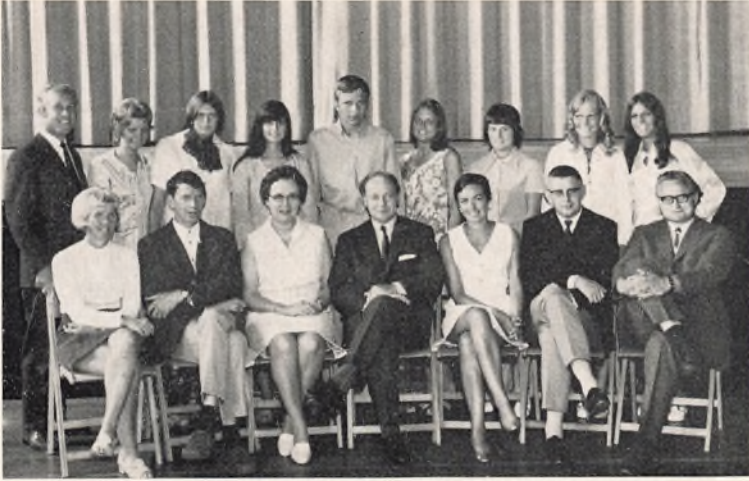
Bangsbostrand skole, 10.B 1970