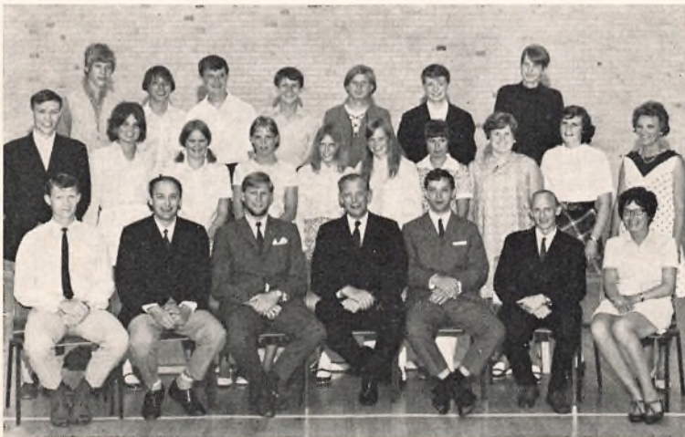
Munkebakkeskolen, 9.B 1970