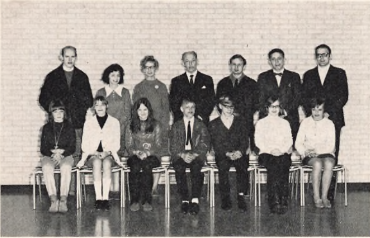
Ørnevejens skole, 9.D 1970