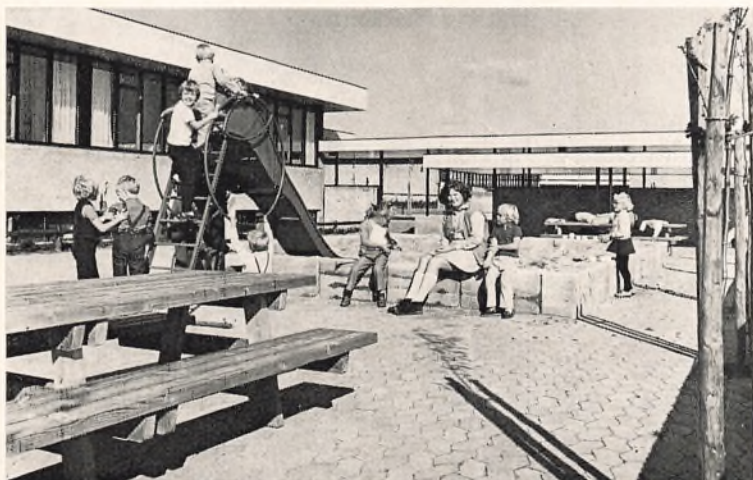
Børnehaveklassen på legepladsen (Hånbækskolen)