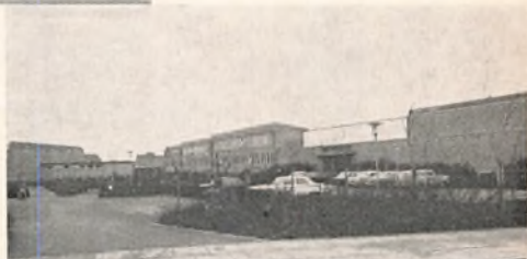
Frederikshavn gymnasium og HF-kursus