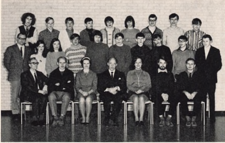
Ørnevejens skole, 10.B 1970