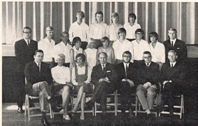
Bangsbostrand skole, 9.C 1970