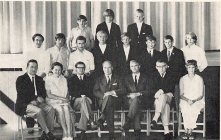
Bangsbostrand skole, 10.A 1970