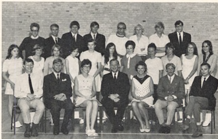
Munkebakkeskolen, 10. klasse 1970