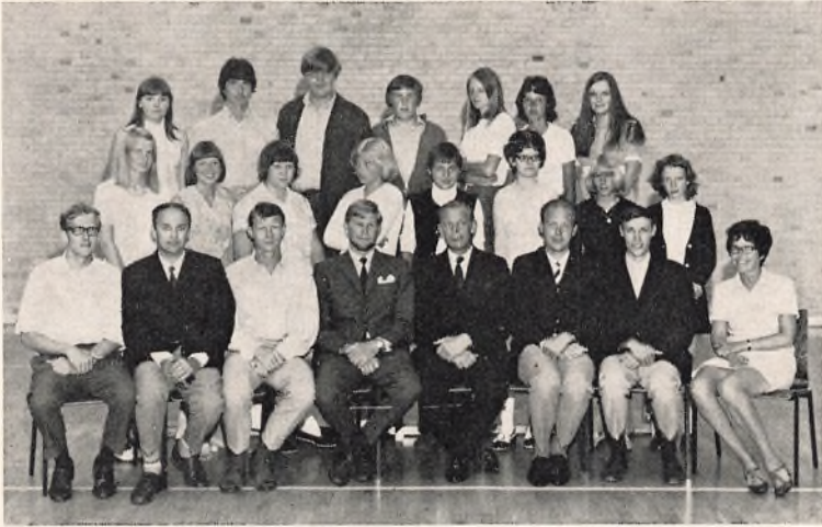
Munkebakkeskolen, 9.A 1970