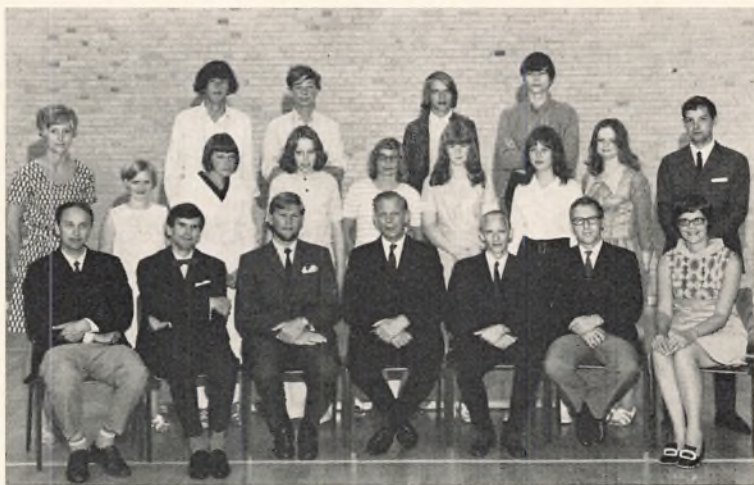
Munkebakkeskolen, 3. real b 1970