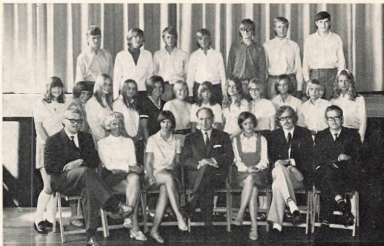
Bangsbostrand skole, 9.D 1970