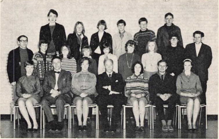
Ørnevejens skole, 9.B 1970