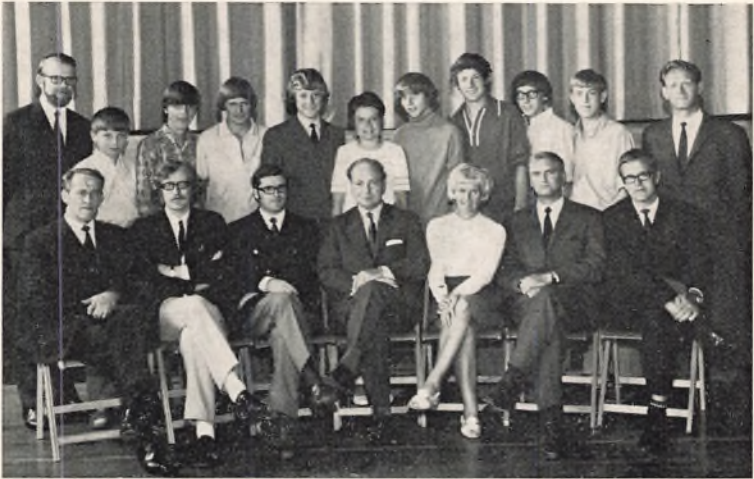
Bangsbostrand skole, 9.A 1970