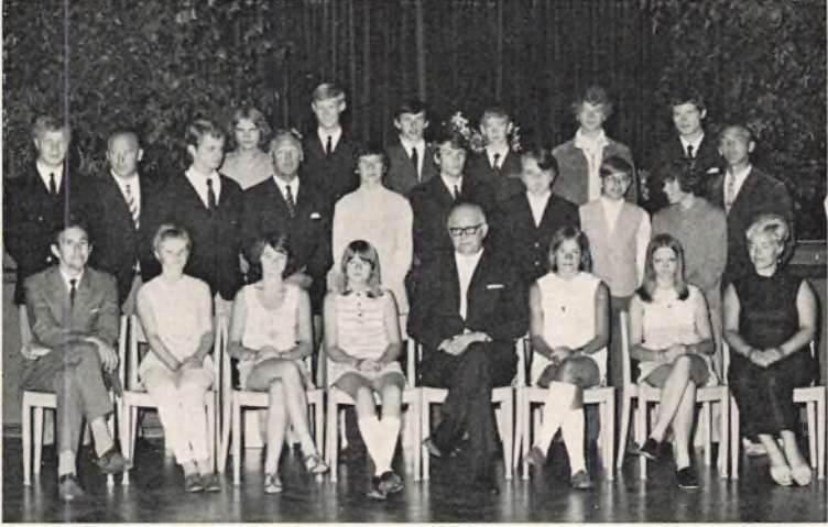
Fladstrand skole, 3. real b 1970