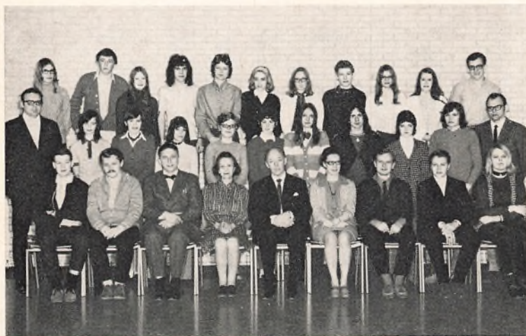
Ørnevejens skole, 3. real a 1970