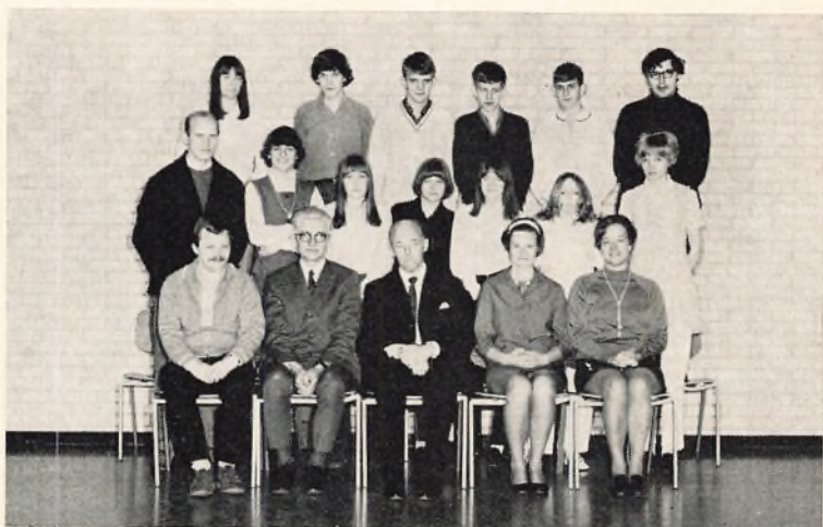
Ørnevejens skole, 10.A 1970