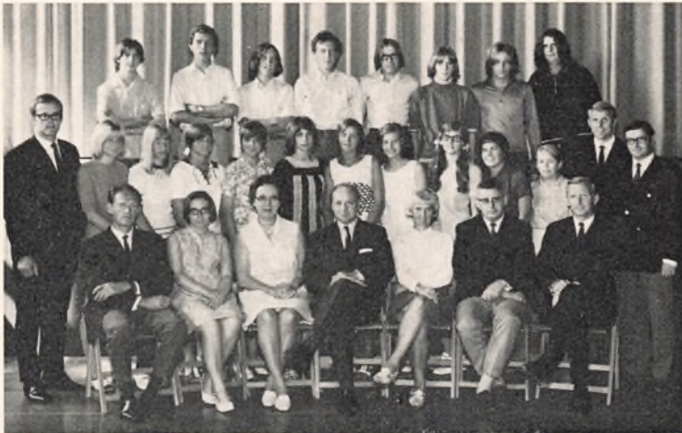
Bangsbostrand skole, 3. real a 1970