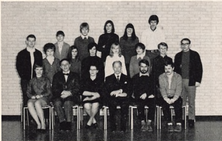
Ørnevejens skole, 9.A 1970