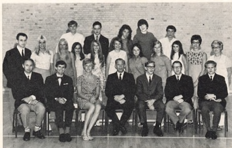
Munkebakkeskolen, 3. real a 1970