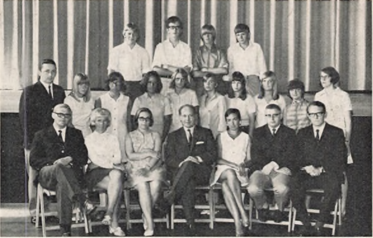
Bangsbostrand skole, 10.D 1970