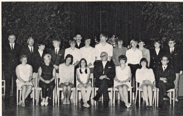
Fladstrand skole, 3. real a 1970