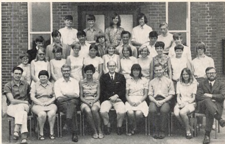
Strandby skole, 3. real 1970