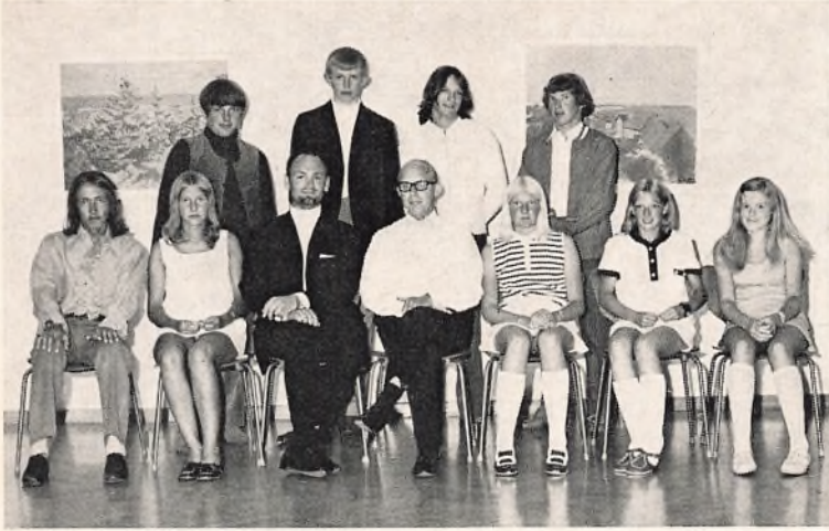
Ravnsbøj skole, 10. klasse 1970