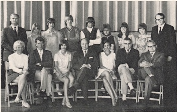
Bangsbostrand skole, 10.C 1970