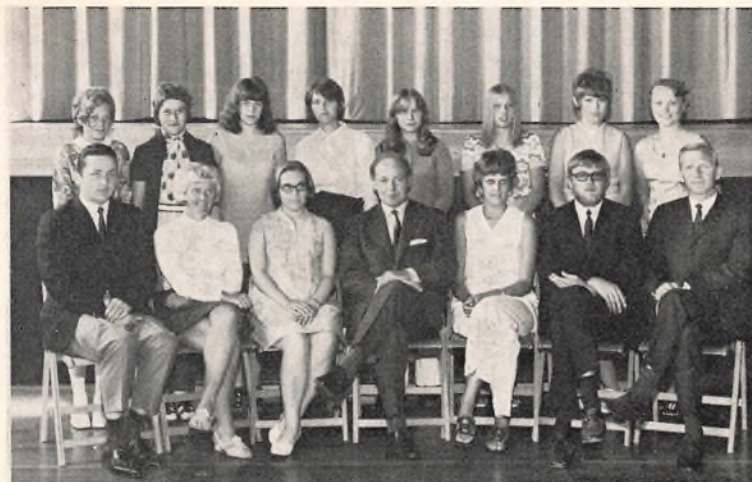
Bangsbostrand skole, 9.B 1970