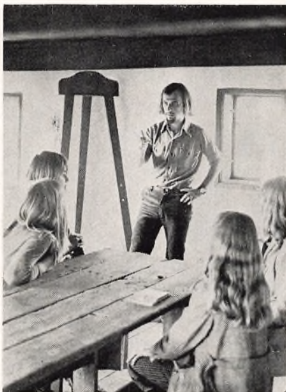
Den gamle skole ved kommandantboligen Romo (8. kl. på lejrskole).

Røde Kors 100 års jubilæum med udstilling, film og indsamling. På skolen indsamledes 1780 kr.