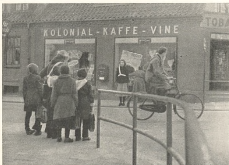
Skolepatrulje ved Ørnevejens skole.