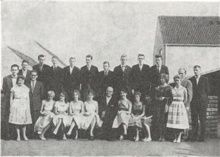
Real a 1960 ved Fladstrand skole