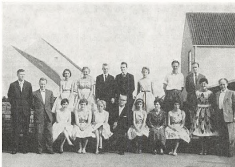
9. klasse, handelslinien 1960 ved Fladstrand skole

I eksamensmellemskolen afholdtes skriftlig årsprøve 1.—3. juni og mundtlig prøve 8.—21. juni. I hovedskolen og den eksamensfrie mellemskole afholdtes skriftlige årsprøver 15.—17. juni og mundtlige prøver 18.—21. juni.