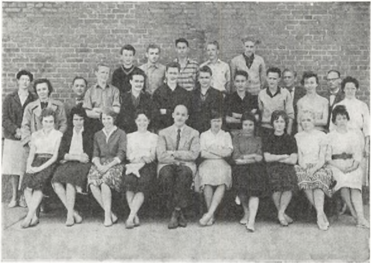
Realklassen 1960 ved Ørnevejens skole