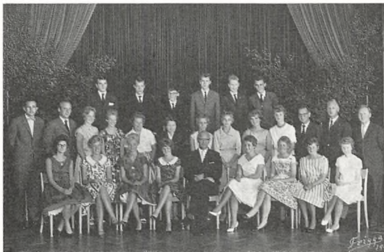
Real b 1960-61 ved Fladstrand skole