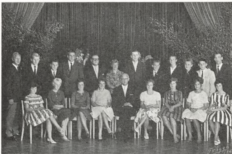
9. klasse 1960-61 ved Fladstrand skole