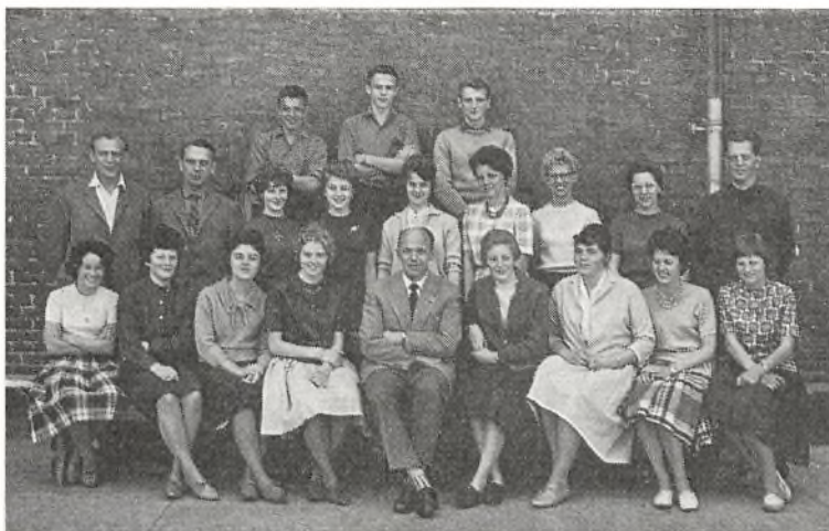
Real a 1960-61 ved Ørnevejens skole