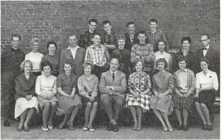
Real b 1960-61 ved Ørnevejens skole