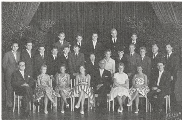
Real a 1960-61 ved Fladstrand skole