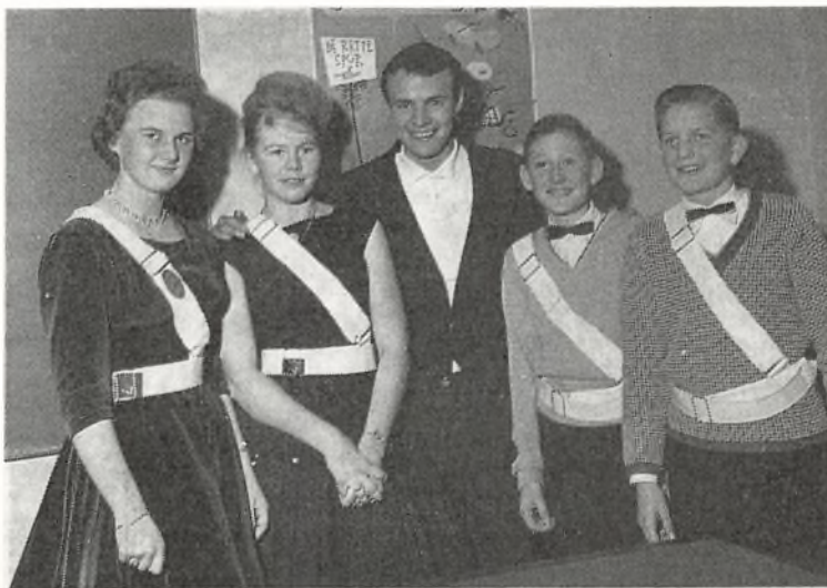
Fra patruljefesten i januar

I slutningen af januar indbød skolepatruljen på Bangsbostrand skole efter indhentet tilladelse fra deres skoleinspektør deres »kolleger« fra byens andre skoler til en fest, hvor et lærerorkester spillede op til bal. Endvidere gav skolevæsenet kaffe; der blev afholdt præmiekonkurrencer og vist en jazzfilm, som faldt i publikums smag. Højdepunktet for eleverne