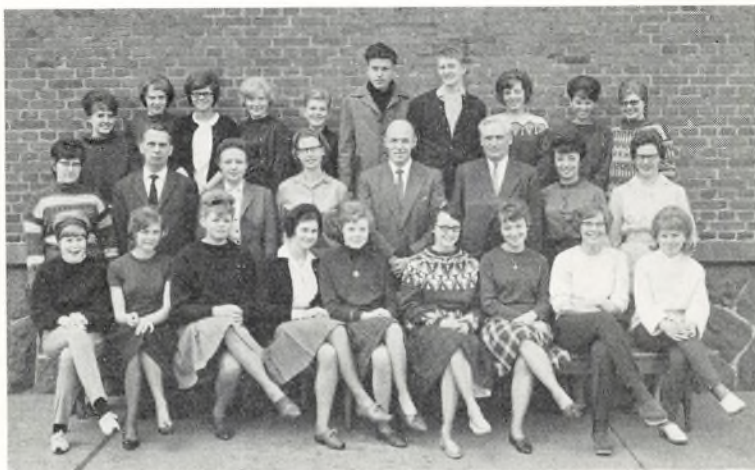
9. handels ved Ørnevejens skole

195 elever (49,9 %) i 8. klasse, 162 elever (41,4 %) i 1. realklasse og 34 elever ( 8,7 %) blev udskrevet af skolen.