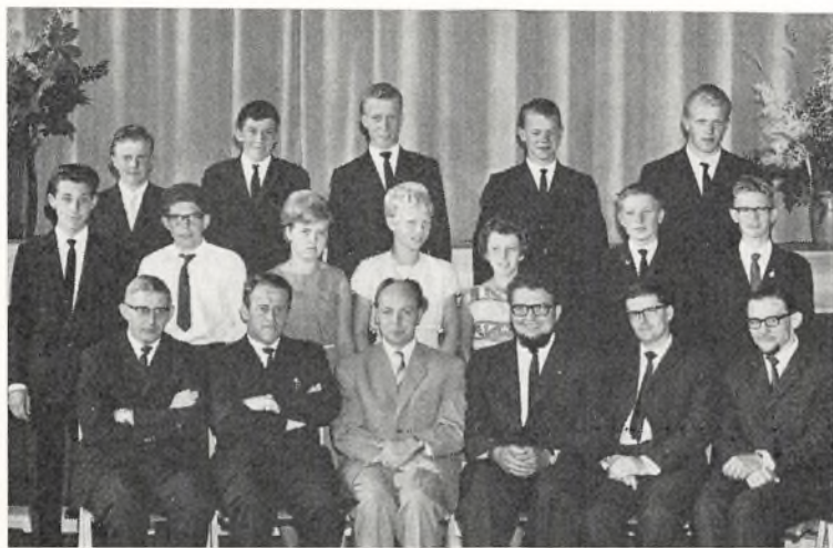
9. a ved Bangsbostrand skole

Den statskontrollerede prøve ved afslutningen af 9. klasse: (Handelslinien).