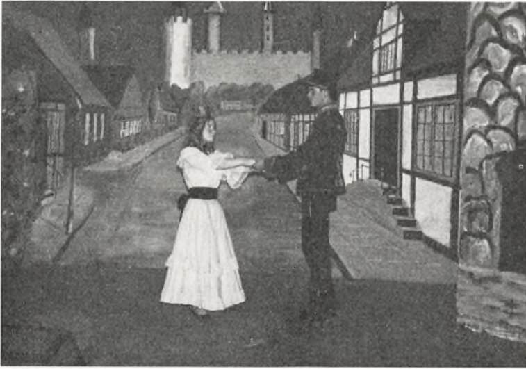
Skolekomedien »Fyrtojet« ved Fladstrand skole

17.—19. december: Julefester for eleverne. Eleverne opfører en eventyrkomedie i seks akter, frit dramatiseret efter H. C. Andersens eventyr »Fyrtojet«. Efter forestillingen leger de små julelege, de store holder julebal.