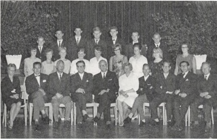
Real c ved Fladstrand skole