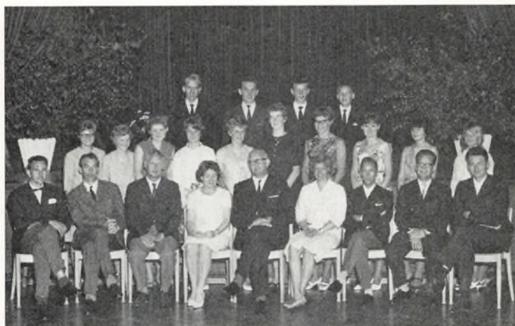
Real b ved Fladstrand skole