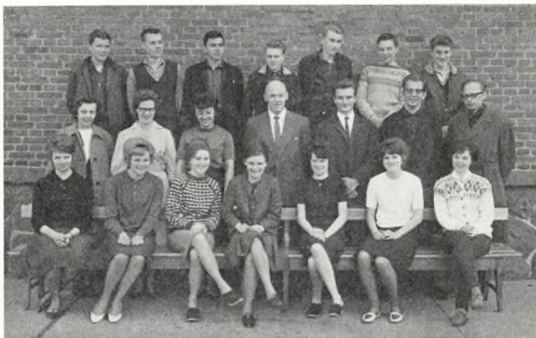
Real a ved Ørnevejens skole