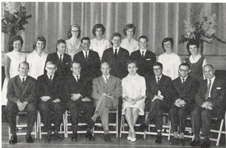
Real a ved Bangsbostrand skole