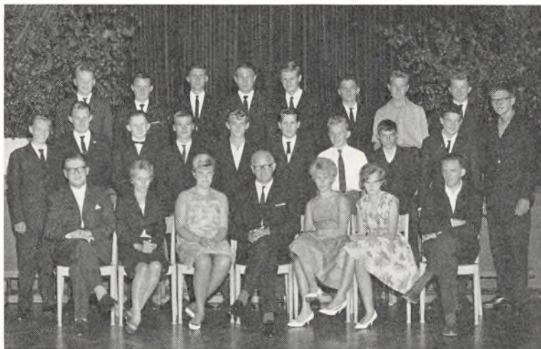
9. tekn. ved Fladstrand skole