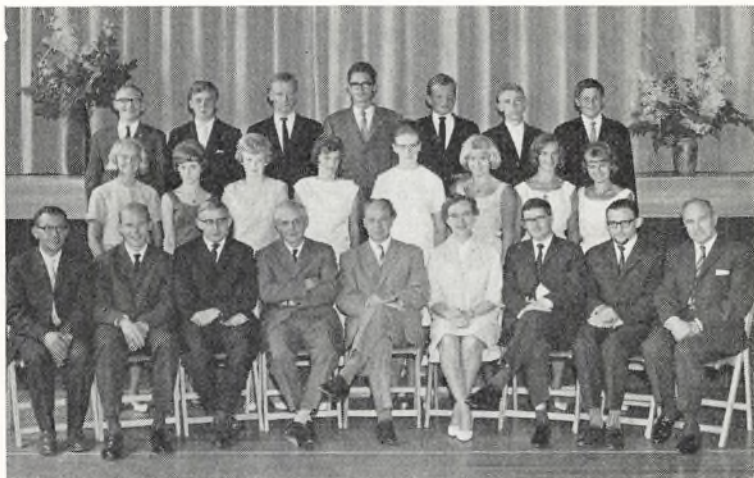
Real b ved Bangsbostrand skole