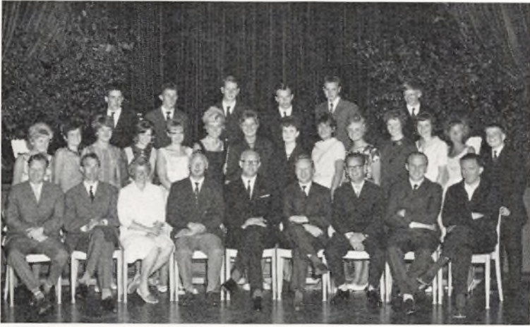
Real a ved Fladstrand skole