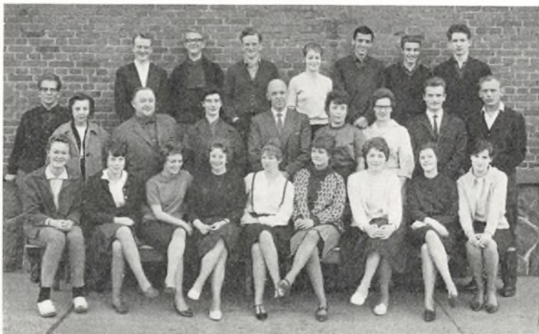
Real b ved Ørnevejens skole