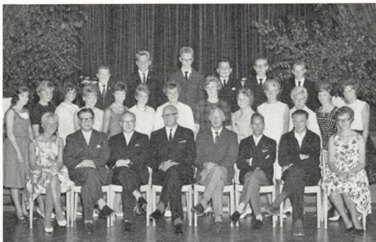
9. a ved Fladstrand skole