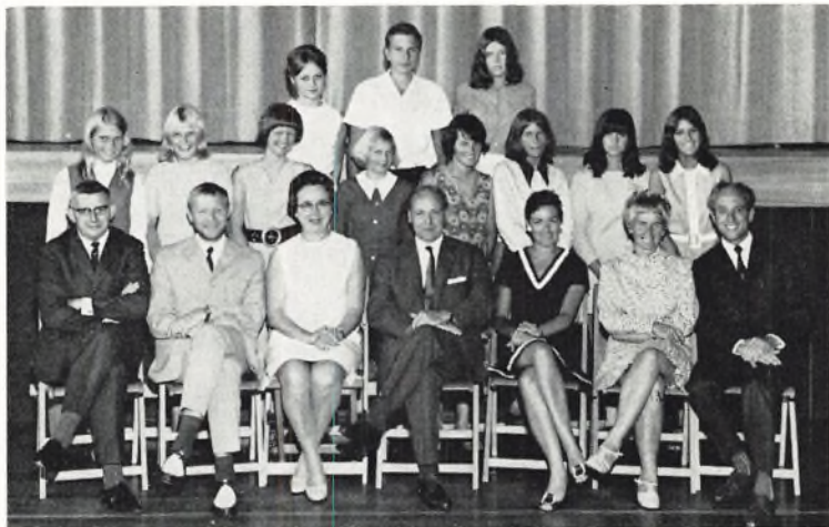
Bangsbostrand skole, 9.B sproglig linie 1969