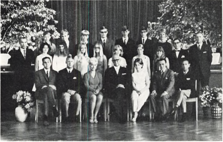
Fladstrand skole, 3. real i 1969