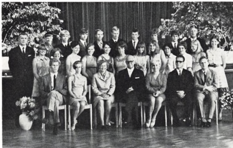
Fladstrand skole, 3. real b 1969