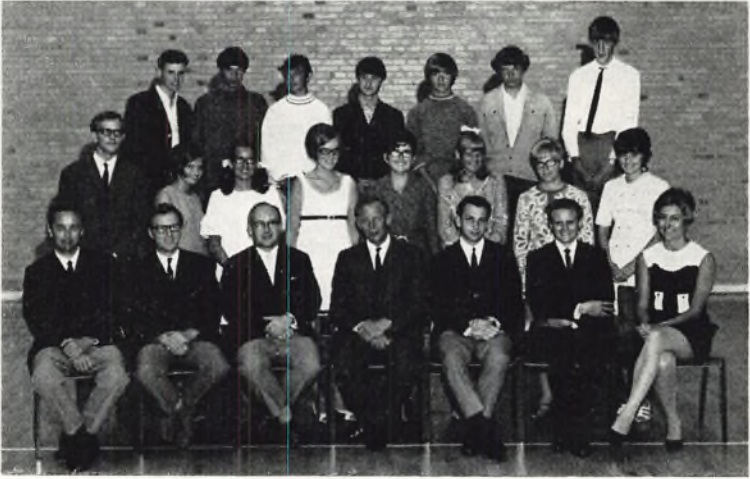
Munkebakkeskolen, 3. real a 1969