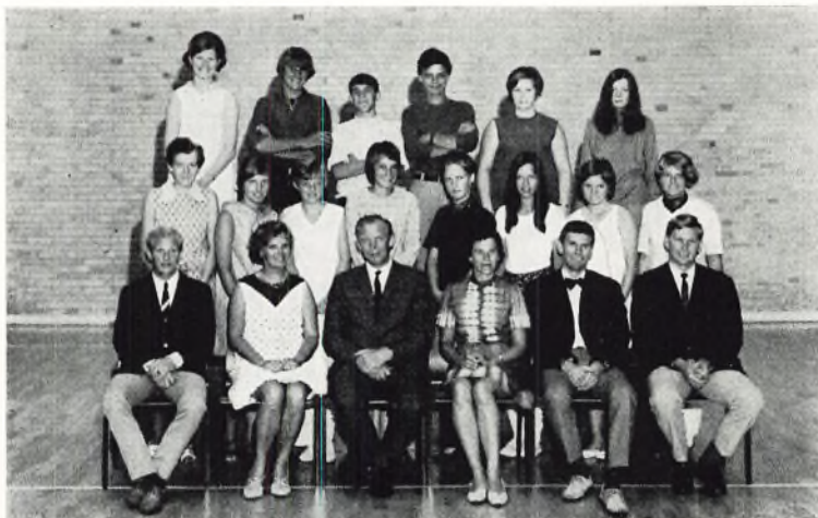
Munkebakkeskolen. 9.B 1969