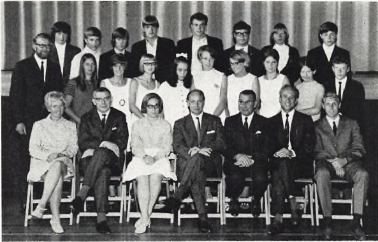
Bangsbostrand skole, 3. real a 1969