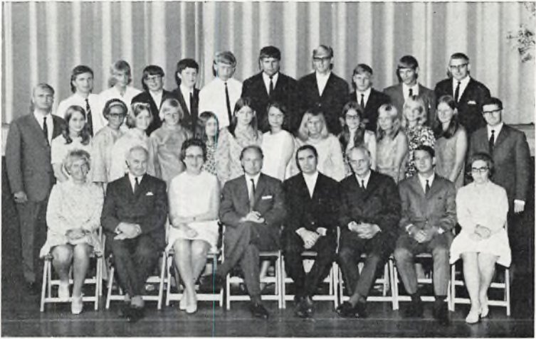
Bangsbostrand skole, 3. real b 1969