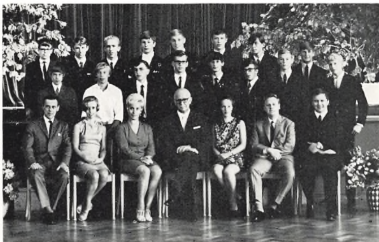
Fladstrand skole, 10.T 1969