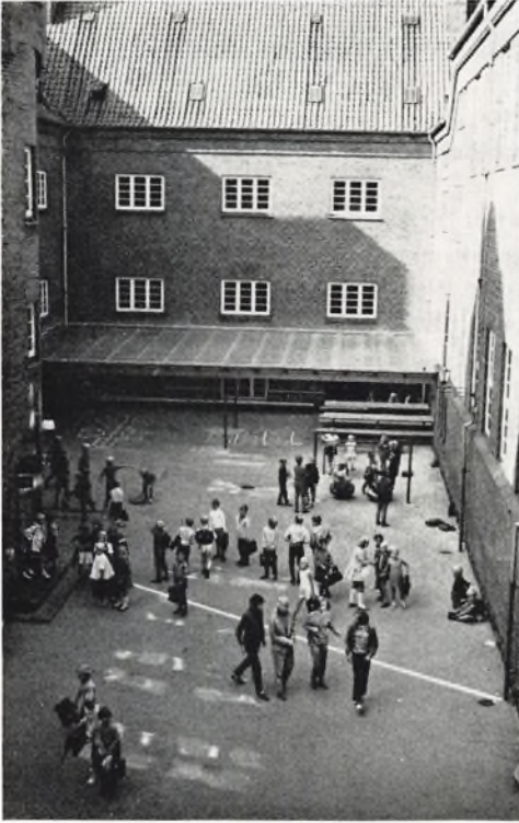
Ørnevejens skole, legegård for 1. og 2. kl.