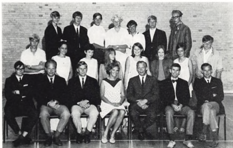
Munkebakkeskolen, 9A 1969