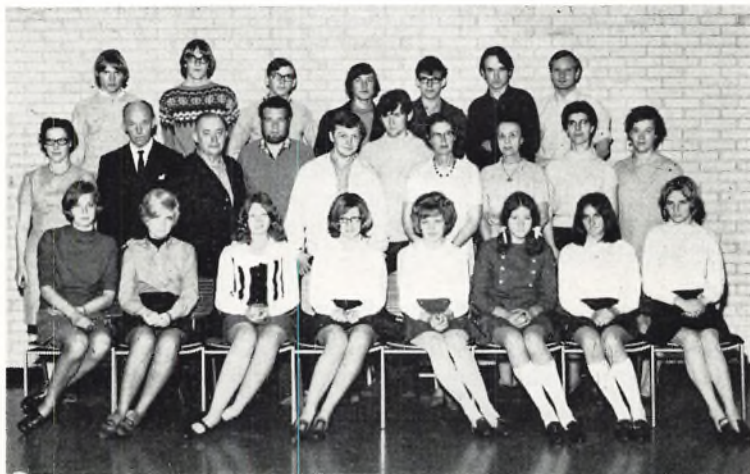
Ørnevejens skole, 3.ra 1969