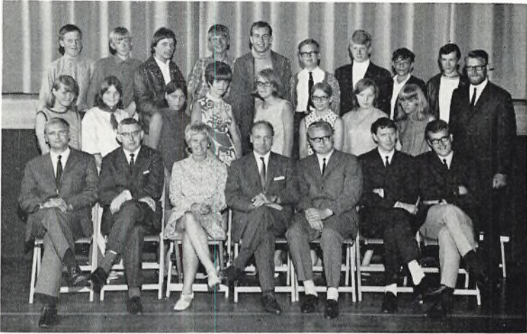
Bangsbostrand skole, 9.D 1969