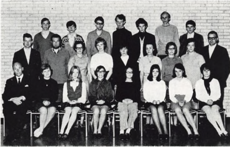
Ørnevejens skole, 3.1b 1969