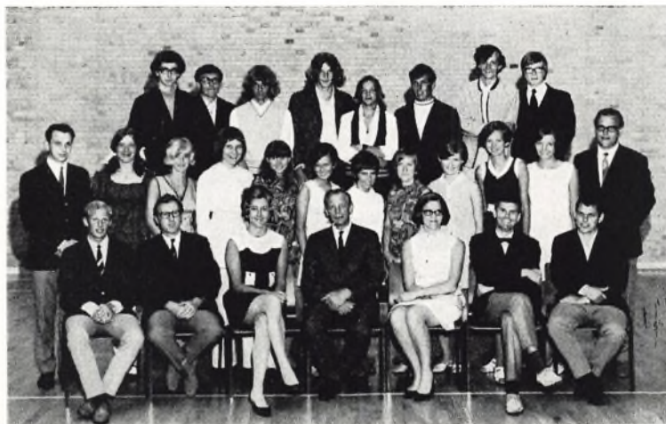
Munkebakkeskolen, 3. real b 1969