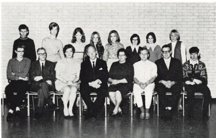
Ørnevejens skole, 10.B 1969