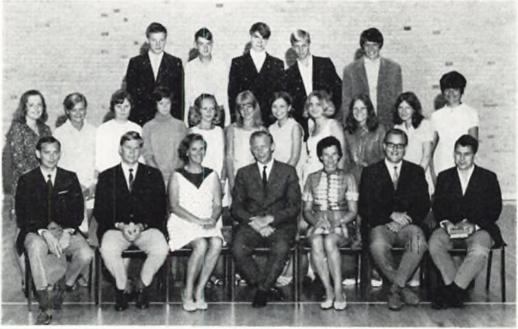
Munkebakkeskolen, 10. 1969