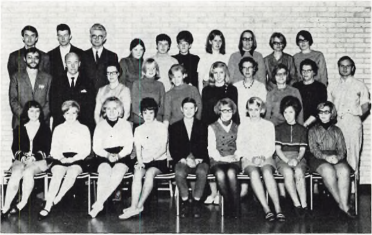
Ørnevejens skole, 10.A 1969