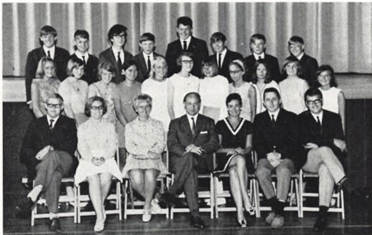
Bangsbostrand skole. 9.C handels- og kontorlinie 1969