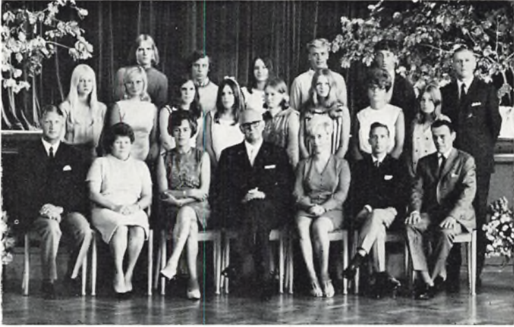
Fladstrand skole. 10.A 1969