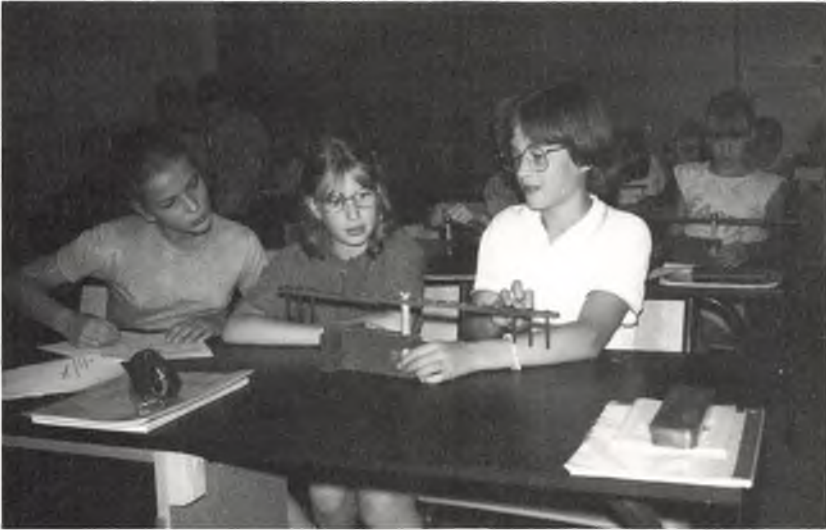
Ein Phänomen wird untersucht

den, daß sich der naturwissenschaftliche Unterricht mit Dingen beschäftigt, denen sie täglich begegnen.