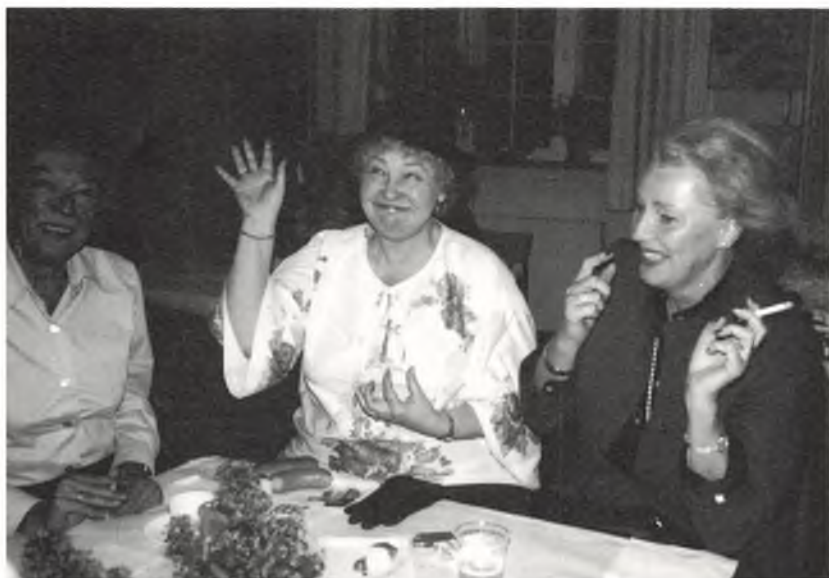
Erinnerungen werden wach - »Oktoberfest« 1983