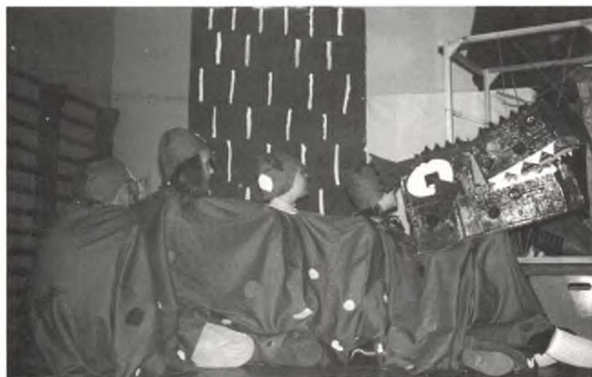
»Der Riese und der Drache«