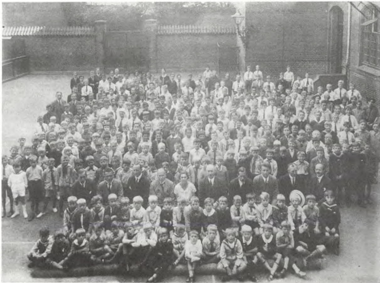
Schüler und Lehrer im August 1926 Der Zweite von rechts in der zweiten Reihe ist Richard von Weizsäcker.