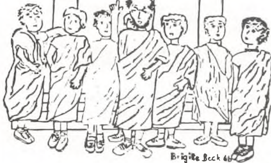
Brigitte Beck 6B

Eine Detektivgeschichte aus dem alten Rom nach dem Buch 'Caius ist ein Dummkopf' von Henry Winterfeld.