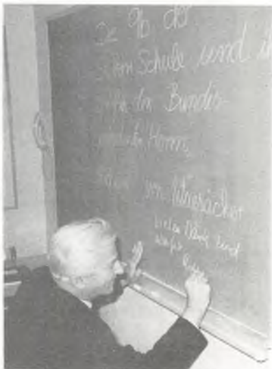
Der Gruß der 9B wird beantwortet.