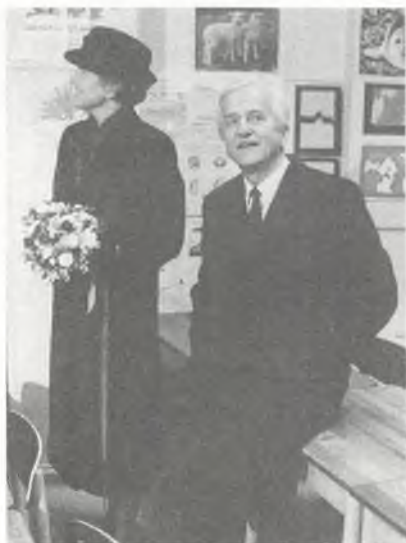
Das Klassenzimmer wirkt fremd. Erinnerungsarbeit!

Wir danken dem Bundespräsidenten für seinen Besuch in der Schule, für sein Geschenk und für die freundlichen Worte über die Schule in seiner Ansprache im Festsaal der Universität. Er hat uns Kraft gegeben und Mut gemacht für die Arbeit an der Schule heute, indem er eine Brücke geschlagen hat zur St.Petri-Schule vor knapp 60 Jahren, in der wir uns auch heute noch wiedererkennen können.