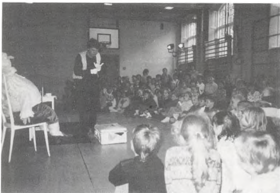
"Des Kaisers neue Kleider"