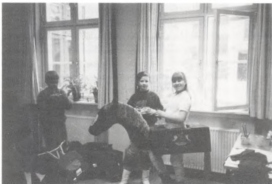
"Zirkusvorstellung" der Klasse 4 A