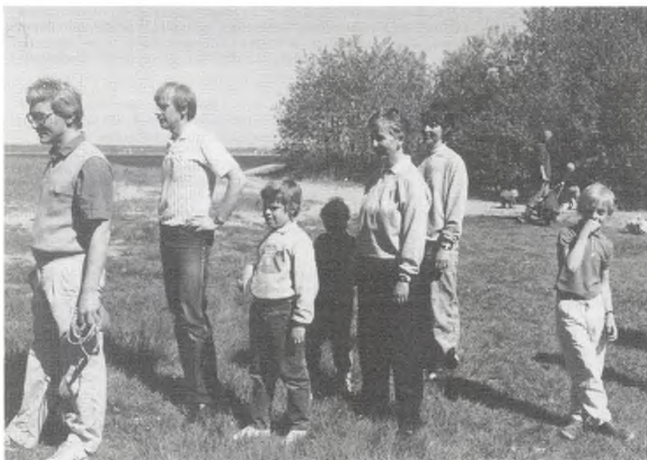
Am Strand von SOMMARIVA bei Helsingør