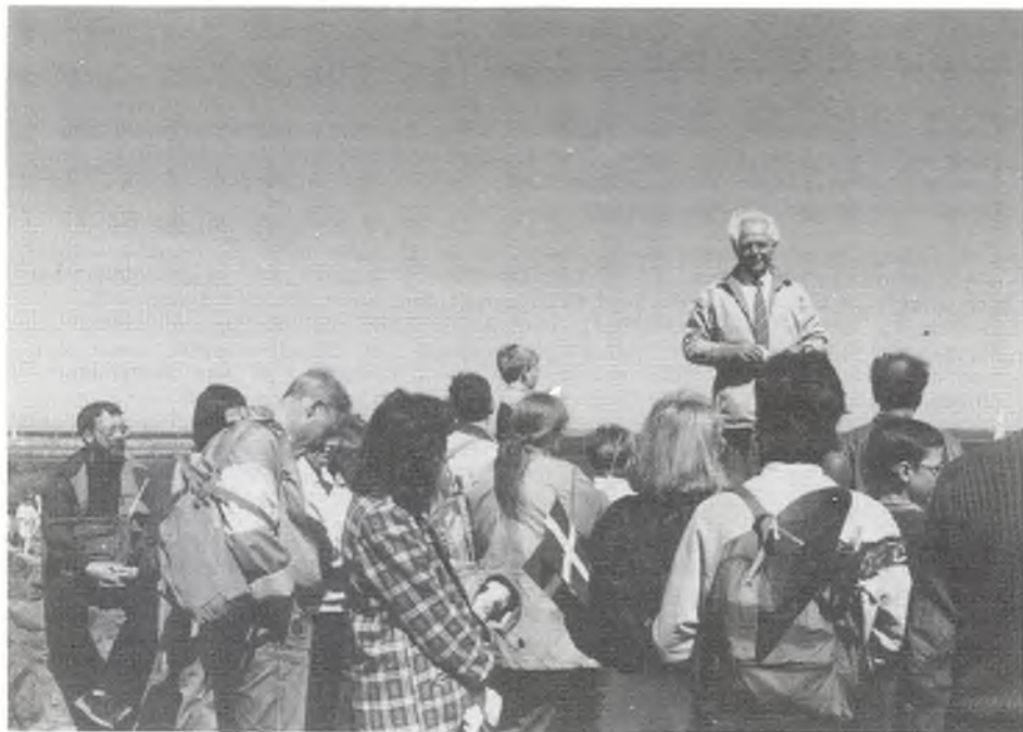
Med St. Petri Skoleforening på Kronborgs bastioner