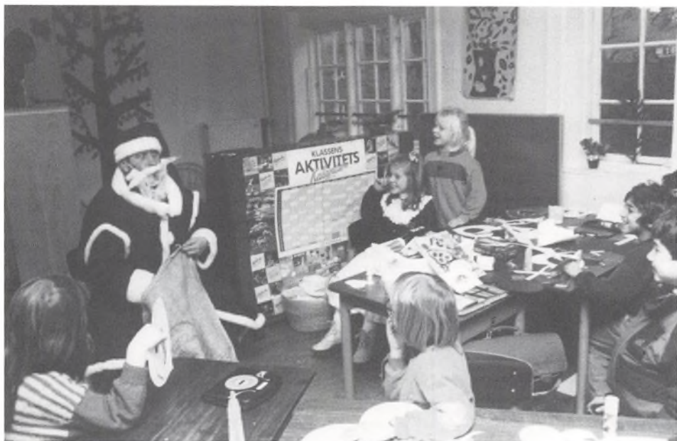
Sankt Nikolaus in der Kindergartenklasse/Sankt Nikolaus i børnehaveklassen.