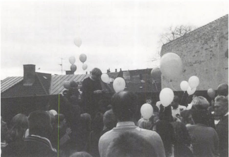
Ballonsteigen beim Oktoberfest/Ballonopstigning ved Oktoberfesten

Nach der Feier Empfang für die abgehenden Schüler und ihre Angehörigen in der Turnhalle der Schule.