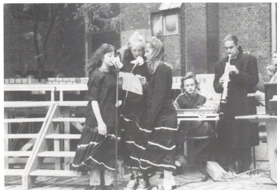
Ein stürmisches Vergnügen/En stormfuld oplevelse