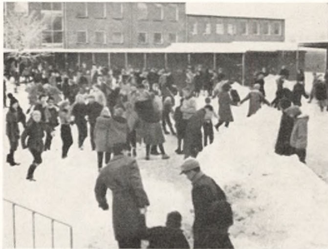
Skolegården i vinterdragt.