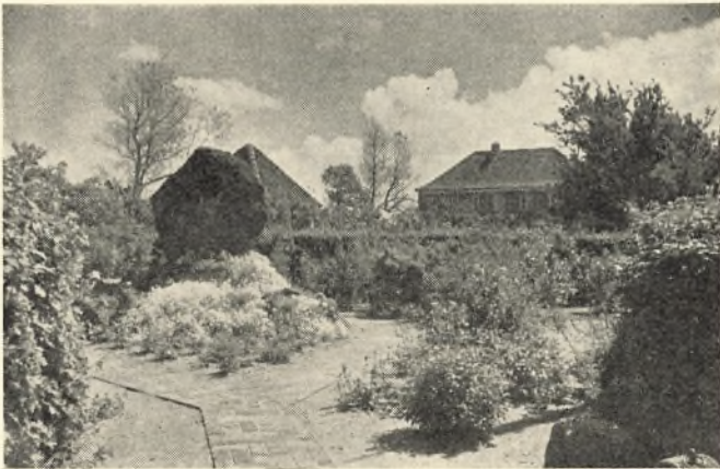
Mindestenen, havehuset og »Borgen«