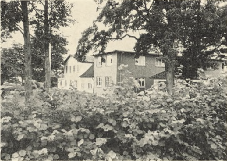
Privatfløj og elevfløj