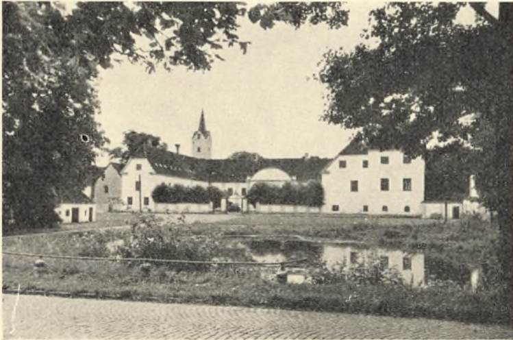
Dronninglund slot og kirke