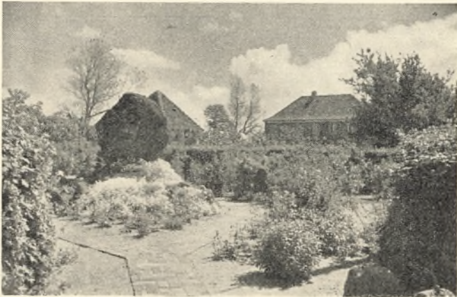
Mindestenen, havehuset og »Borgen»