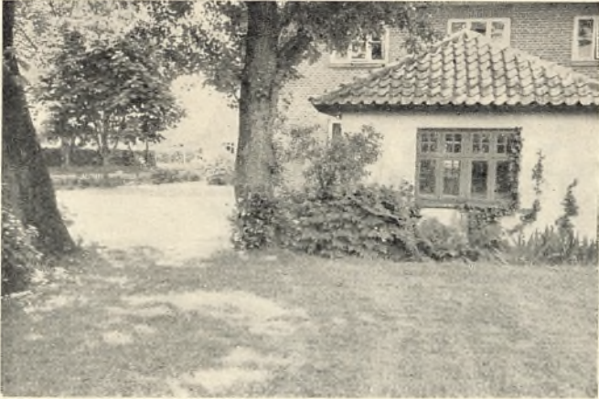
Parti fra haven