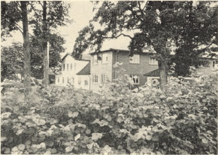
Privatfløj og elevfløj