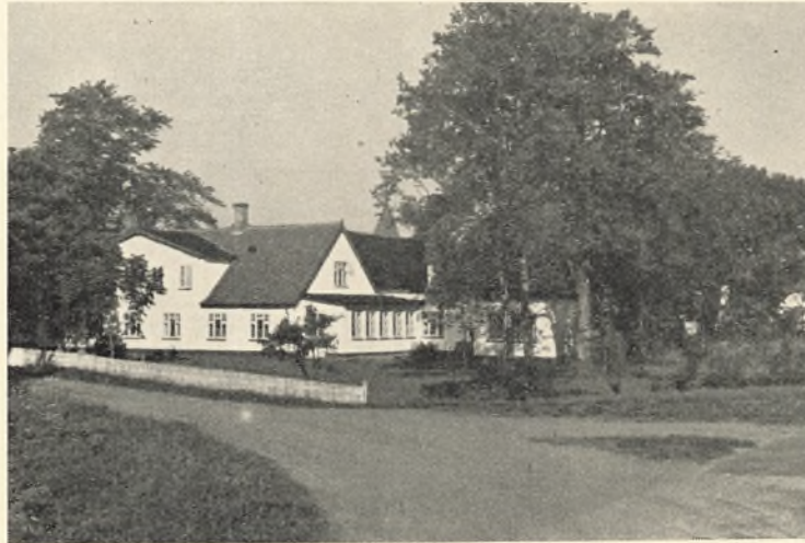
Privatfløjen med elevpisestue

Det er en selvfølge, at den enkeltes udbytte af et højskoleophold i højeste grad afhænger af vedkommendes flid og af viljen til at leve sig ind i skolens ånd og tone.