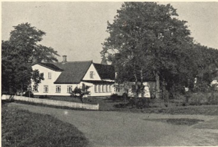
Privatfløjen med elevspisestue

Det er en selvfølge, at den enkeltes udbytte af et højskoleophold i højeste grad afhænger af vedkommendes flid og af viljen til at leve sig ind i skolens ånd og tone.