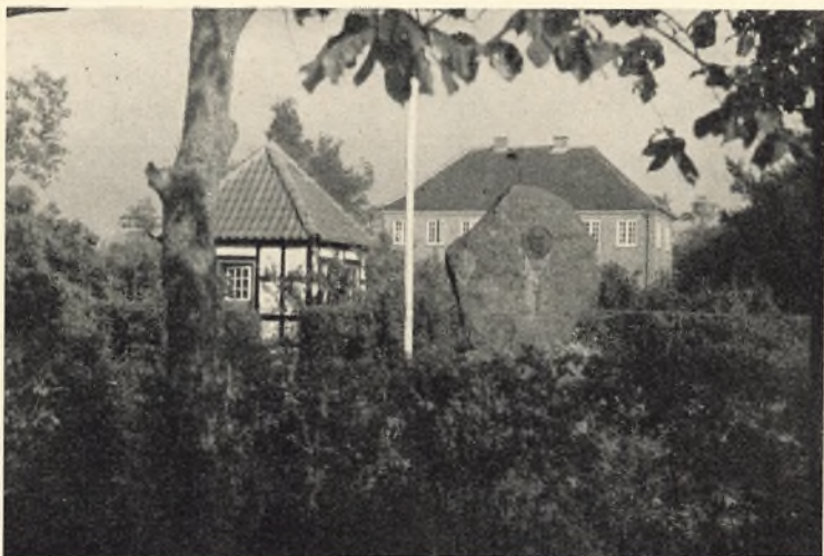
Mindestenen, Havehuset og »Borgen« (Lærer- og elevbolig)