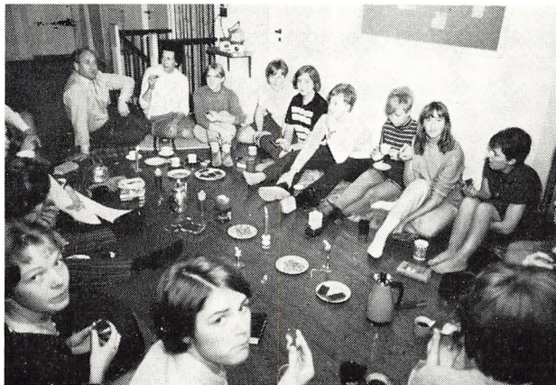
»Kaffemik« på hvide fløj