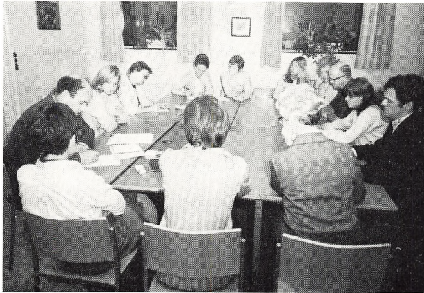
Lærer- og elevrådsmøde