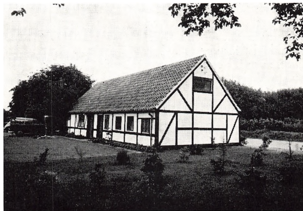
Bedstemoders hus hvor vort nye aktivitetsrum er indrettet i den ene fløj