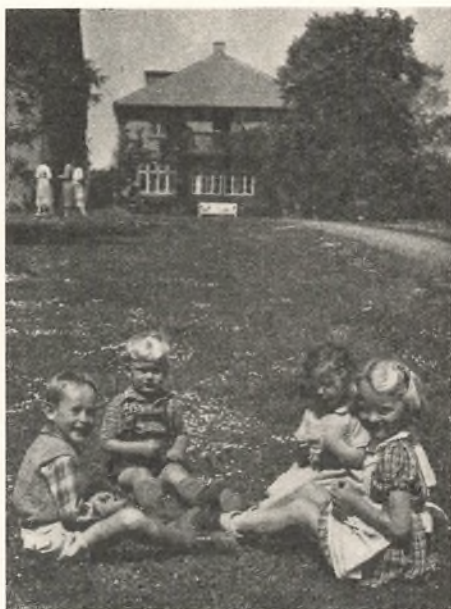
Fire gode venner.