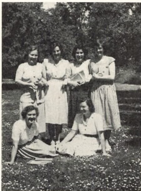
Blomster i græsset.