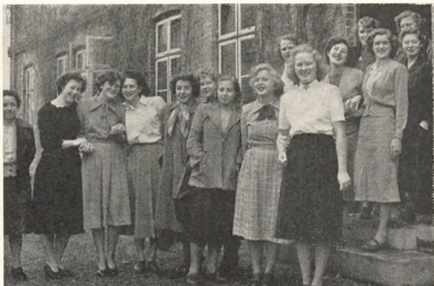
Fra vinteren 50—51.