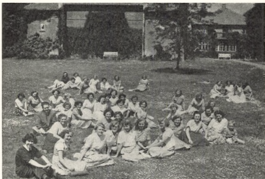
En dejlig sommerdag.