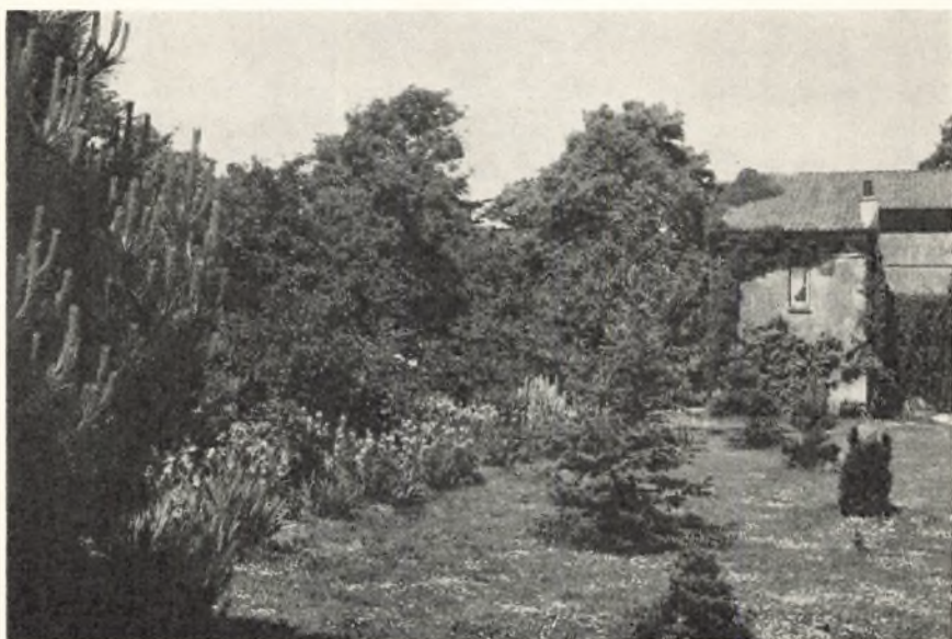
Et smukt havebillede.