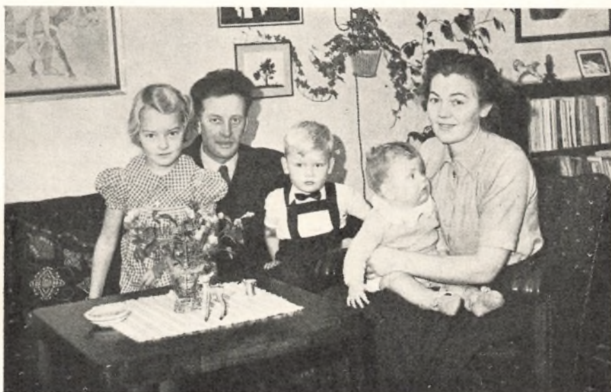
Familien i Røde Hus.