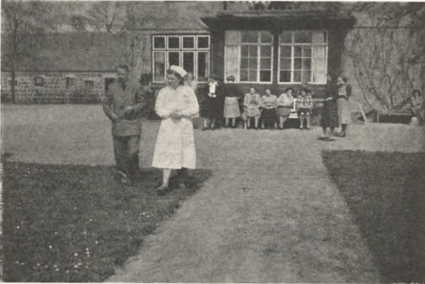
I dybsindig samtale.

var ikke den store kunst, men det var festligt, og vi morede os kosteligt paa begge sider af orkestergraven.