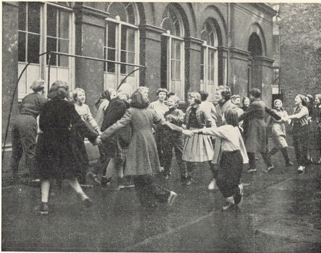
Billede fra legepladsen.