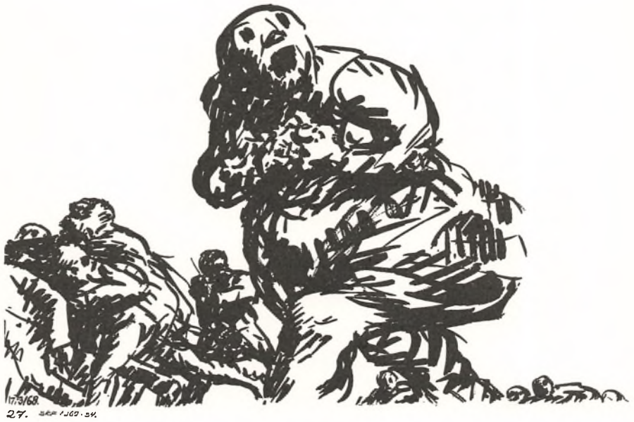
Palle Nielsen: Dagbog 27. Penseletegning, tusch, 1968.