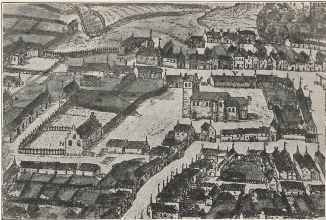
Kolding lærde Skole ved Aar 1600. (Paa Billedet mærket med N.)