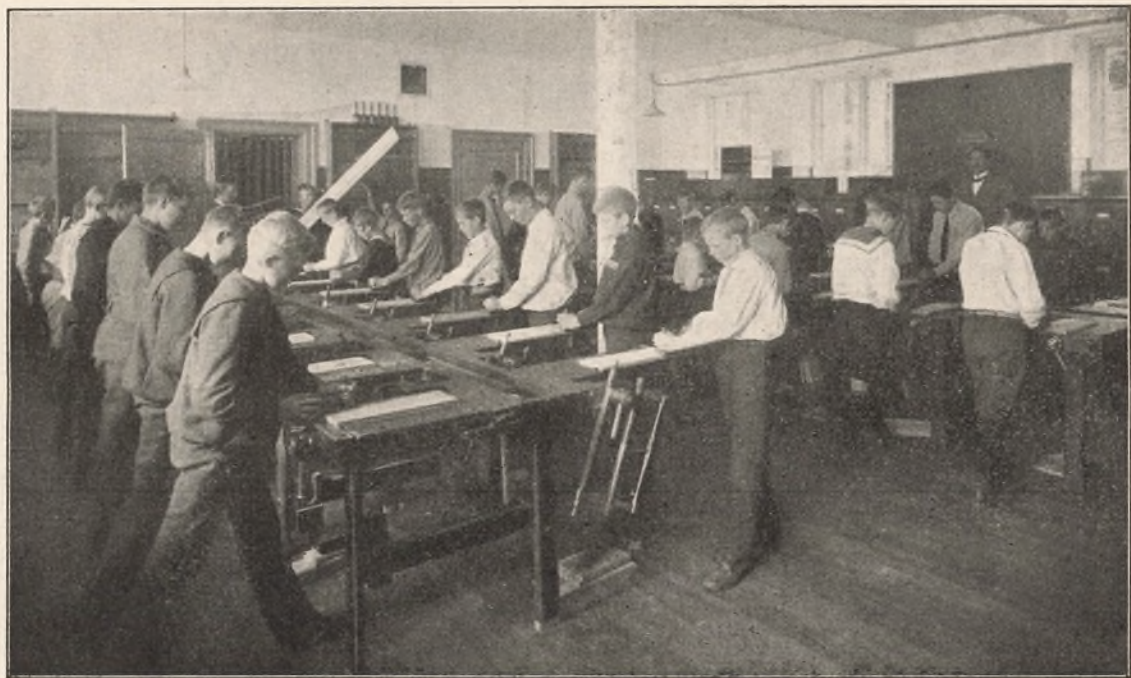
Slojdsalen i den nye Skolebygning.