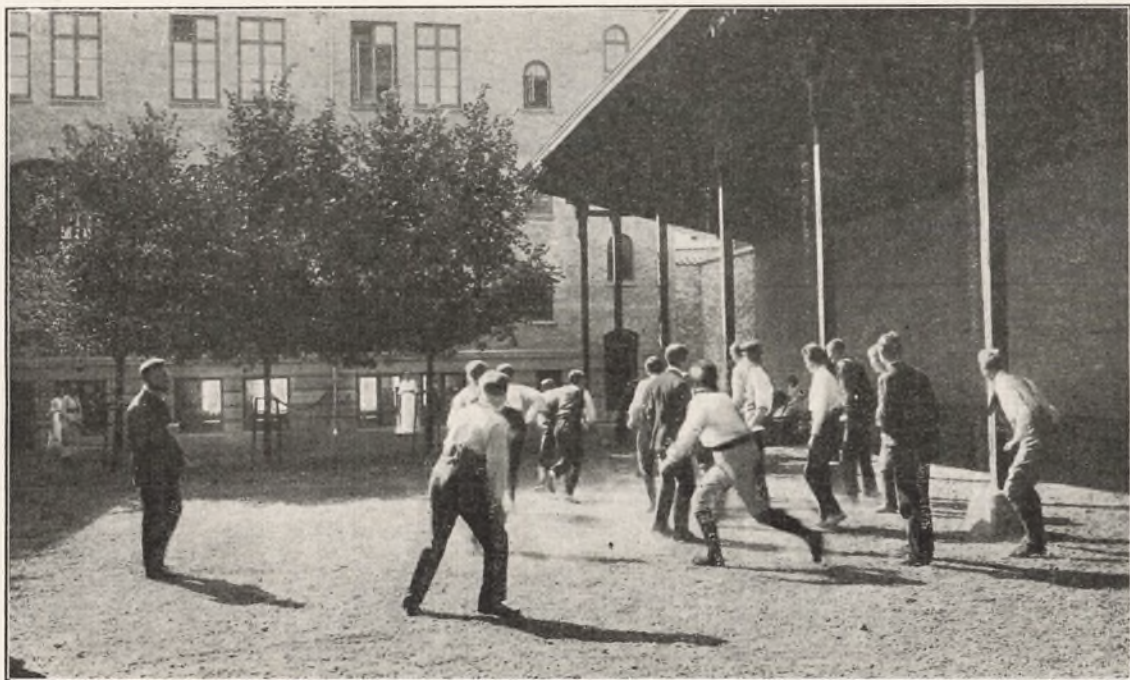
Legepladsen foran den nye Skolebygning.