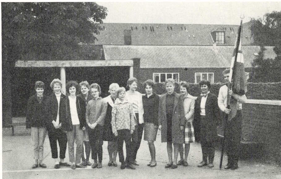
Det vindende hold.

2.–8. november. Børnebogsuge (plakater m. v.).