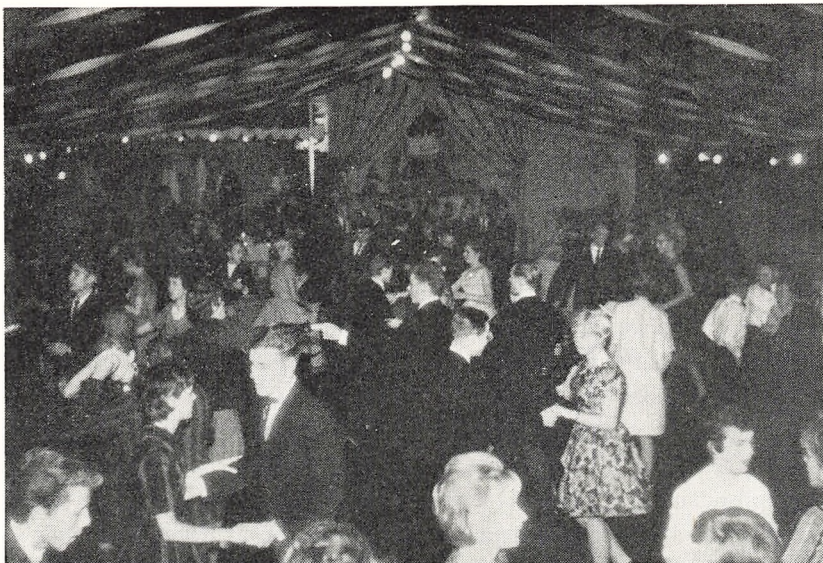
Og dansen den går . . .

November. Klasseindsamling til Red Barnet's spedalskhedskampagne i Indien. Resultat: kr. 979,75.