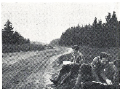
Hærvejen ved Kropperbusch.