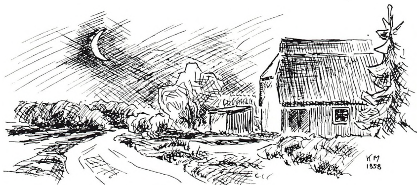
Hærvejen ved Wilhelms på Krup Hede.

Kan det end idag være svært at se en fremtid for det danske, så må det vel være så. Det var aldrig i de stille sommernætter, det kaldte stærkest fra den gamle vej. Mest var det, når storm og uvejr gik på. Derfor: Skulle vi endnu en gang blive skuffede, da er det godt at vide, at endnu spørger det på dansk hernede; og den dag kan komme, da kaldet atter lyder stærkt og uimodståeligt.