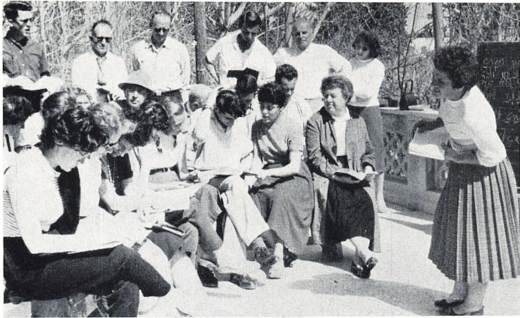
Fra 70 forskellige lande er joderne kommet tilbage hertil. — For at hjælpe på sprogvanskelighederne har man rundt i landet skoler med kursus i hebraisk. — Min mand var på et sidste år, og forstanderinden — yderst til højre — forlangte, at hver elev skulle have hele bibelen på sit eget sprog og Det gl. Testamente eller hele bibelen på hebraisk. — Her ses forstanderinden dele bibelen ud.

Gud. Han fortalte endvidere, at han og hans kone havde set flere religioner på nærmere hold, og de var enige om, at moralsk set stod de kristne højest. Og han udtrykte ønsket om, at hans kone og børn måtte blive kristne. Han er en rigtig slider, ærlig og siger rent ud, at han ikke ønsker at blive en kristen for fortjenestens skyld. — Så mange kommer og beder om at blive kristne og skjuler ikke, at grunden er, at de ønsker hjælp til at rejse ud af landet. Jeg er sikker på, at om ovennævnte bliver overbevist om, at Jesus Kristus er Messias, vil han ikke gå tilbage for de trange kår, som vil følge med.