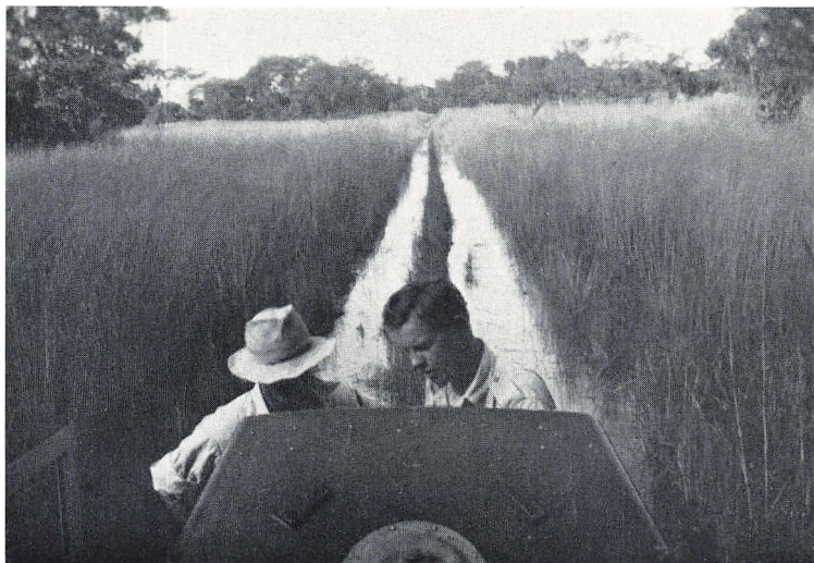
På safari i regntiden.

lærers arbejde, det at føre dagbøger, rette opgaver, holde orden o. s. v. Det synes også vanskeligt for dem at skelne mellem, hvad der har værdi, og hvad der er uvæsentligt, samt at planlægge deres arbejde, så det trin efter trin fører til de ønskede resultater.