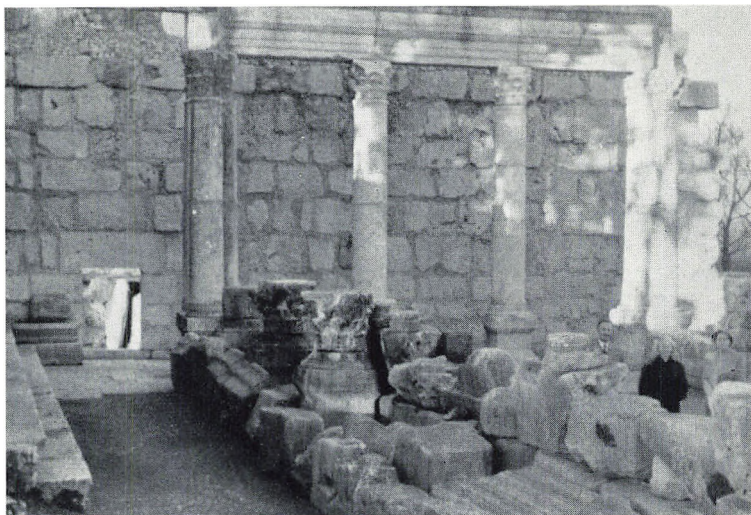
Man har fundet rester af synagogen — vistnok fra Jesu tid — i Kapernaum. — Ellers er der intet tilbage af byen, jvf. Matt. 11, 23 og Luk. 10, 13—15.

tage hen, tog lægen ham ind her for natten og gav ham noget at spise. I dag fortæller han, at han er fra Argentina, kom hertil for at studere landbrug og skulle rejse tilbage til Argentina igen, men blev kaldt ind som soldat, gjorde alt muligt for at slippe, stjal et pas og prøvede på at komme ud af landet, men blev fanget og måtte gå seks måneder i fængsel. Han siger, han har læst Det nye Testamente og læser hver dag flere kapitler i Bibelen. Er det hele opspind, eller er han af dem, der er i virkelig nød? Foreløbig har han fået lov at arbejde her en tid for kost og logi. — Man bliver så skeptisk, men en kold skulder åbner ikke vej for evangeliet, men på den anden side er det ikke vor opgave at dele penge ud til højre og venstre. Vi er her for at være et vidnesbyrd om den kærlighed, som Gud i Jesus Kristus har vist os, og vi trænger til forbøn, så vi må være det i ord og i gerning.