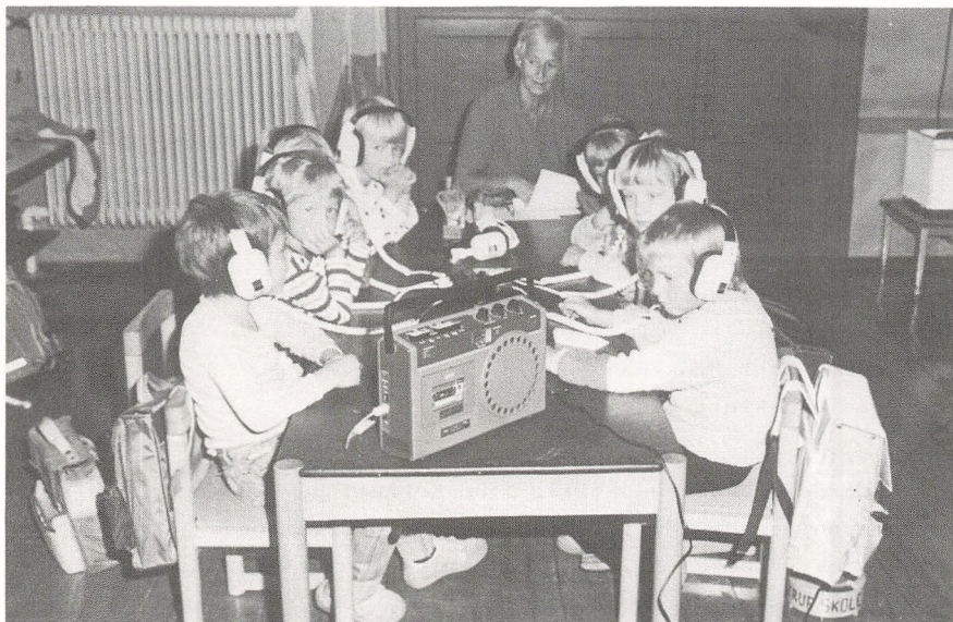
Børnehaveklassen på Drigstrup skole bruger den moderne teknik.

Husk at anmeldelse til forsikring altid skal foretages af forsikringstageren selv. Skolerne kan kun anmelde de tilfælde, der kan henføres til kommunens ulykkesforsikring.