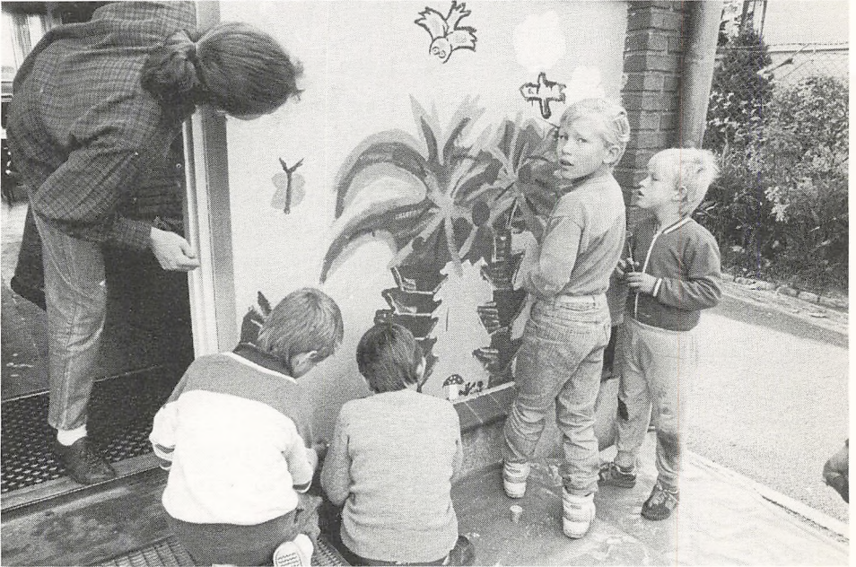
Fra elevudsmykningen i skolegården.

Automattelefon ved lærerværelset 09 32 11 90.