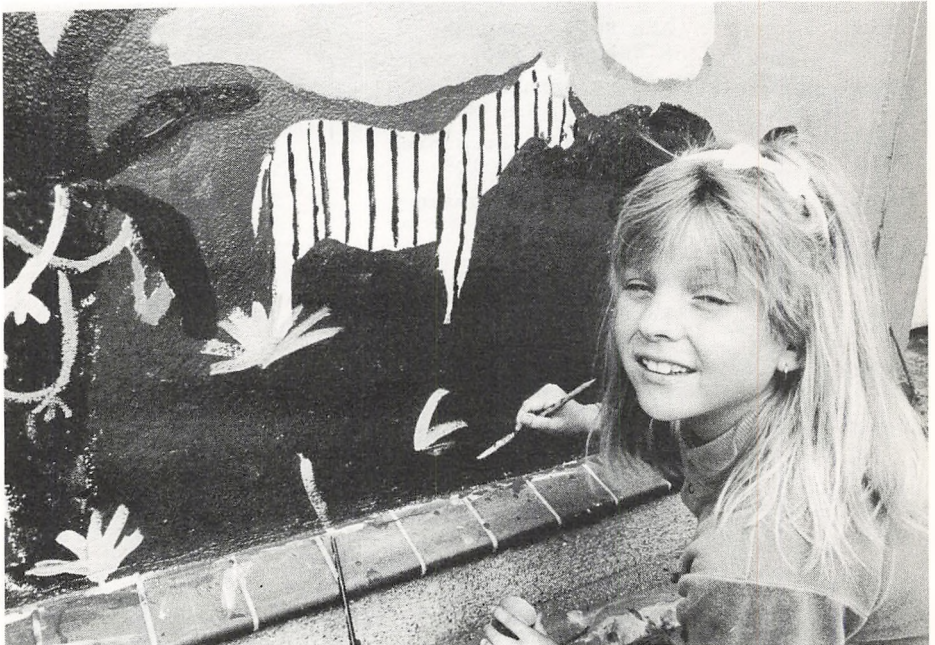
Fra elevudsmykningen i skolegården.