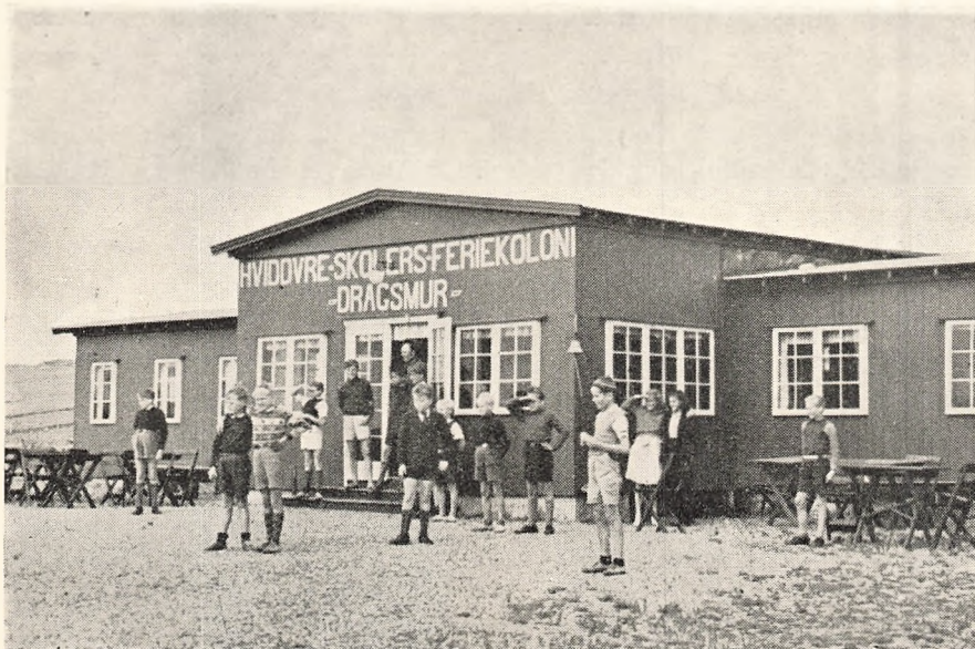
Lejren en Graavejrsdag, set fra Vejen.