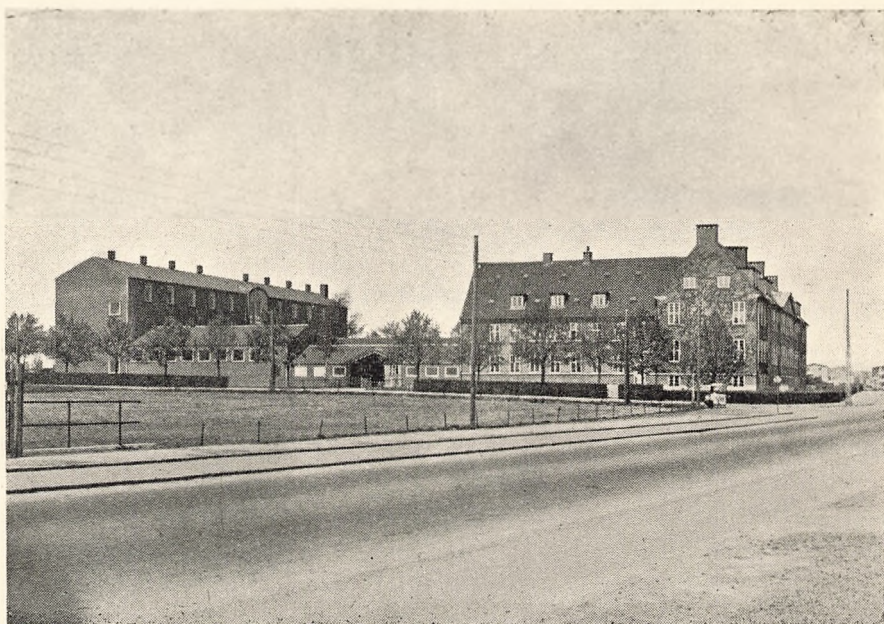
Den fuldførte Kettevejsskole set fra Syd (Maj 1948).