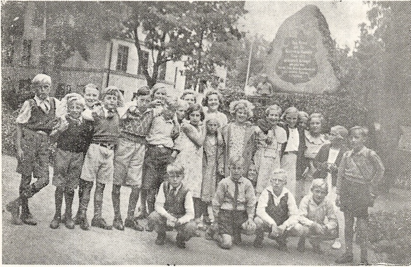
Graven ved Alfarvej i Bøffelkobbøl.