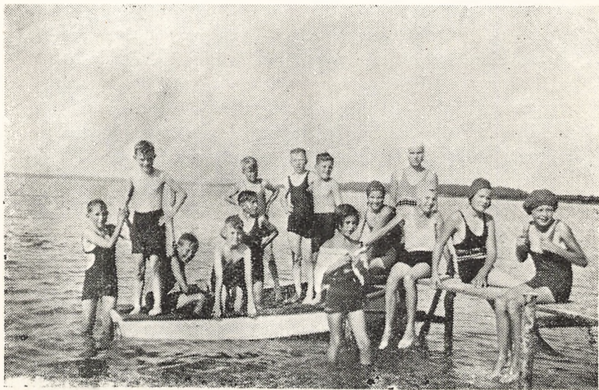
Børnene bader i Alssund.

I Dagene fra den 24.—29. August foretog Østre Kommuneskoles 6c Klasse under Klasselærerens Ledelse en Skolerejse til Sønderjylland, hvor Børnene var indkvarteret i private Hjem paa Als. Hver Dag foretoges Udflugter pr. Bil fra vort Standkvarter til de mange historiske Steder, og da Vejret var straalende, benyttedes Fritiden flittigt til Badning.