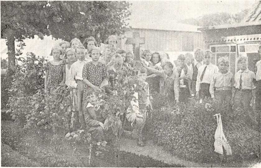
Børnene paa den gamle Kirkegaard i Flensborg.