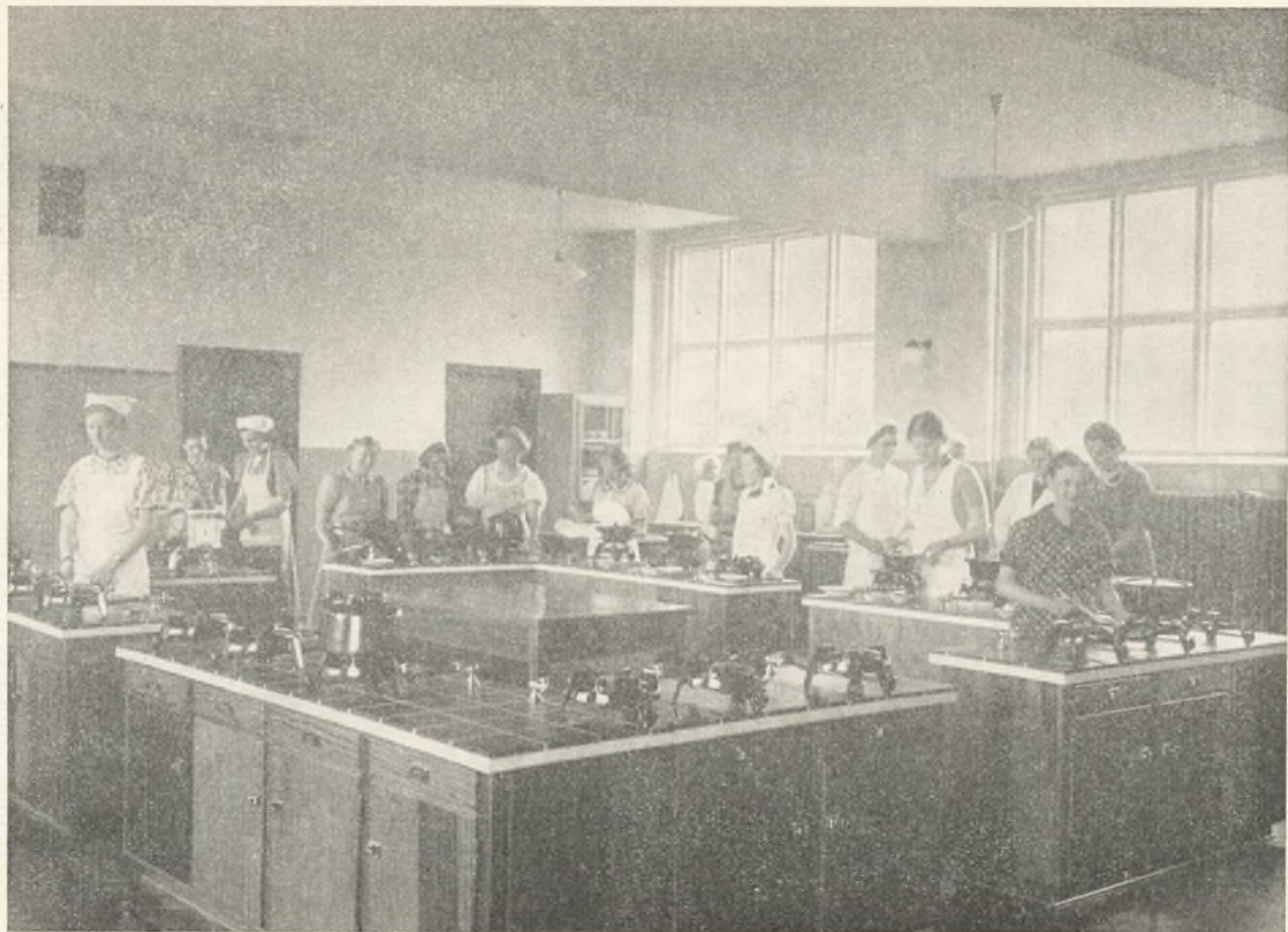
Ungdomsskolen i Arbejde.