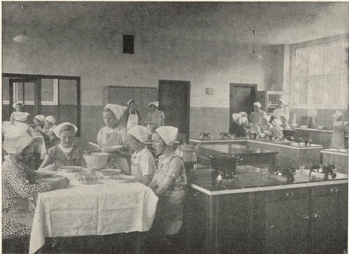
Folkeskolen i Arbejde.