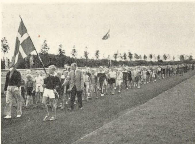
Indmarchen på idrætsdagen