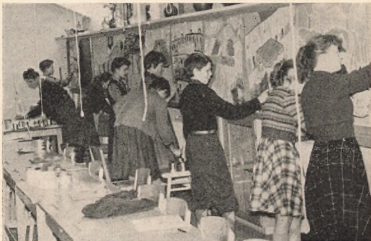
Skoleelever på Sønderlandsskolen forbereder H. C. Andersen-festen.

Sønderlandsskolen: 29/11 : Skolekoncert til fordel for anskaffelse af en skolefane, som indviedes ved en smuk højtidelighed onsdag den 4. maj.