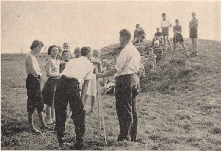
Arbejde i marken — lidt landmåling og nivellering.

hver elev får eet lejrskoleophold i sin skoletid. I lejrskolen undervises eleverne dels inde og dels ude flere timer hver dag i forskellige emner. Dertil kommer ekskursioner til steder, hvor de berørte emner kan undersøges nærmere (teglværket, et mønsterlandbrug, Vestervig kirke, Helligsø kirke o. s. v.). De lærere, der har undervist i lejrskolen, har indtryk af, at børnene har godt af opholdet, der medfører nærmere kontakt med kammeraterne og lærerne, end der almindeligvis opnås herhjemme.