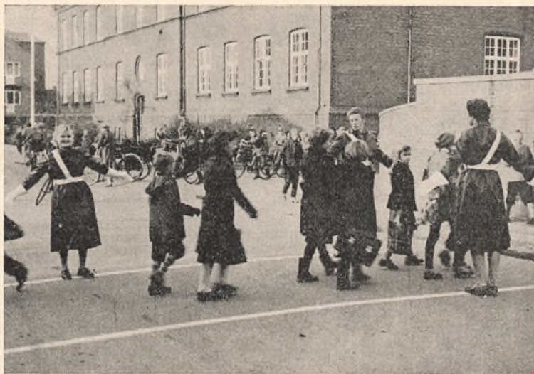
Skolepatrulje i virksomhed ved Danmarksgades skoler.

Færdelsesundervisningen i skolerne blev i skoleåret aktualiseret med velvillig bistand fra politiet, idet nogle af byens politibetjente blev stillet til rådighed for skolerne dertil, og hver klasse fik en time i færdeslære.