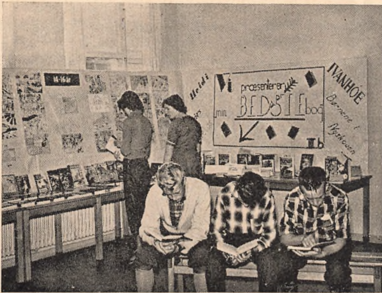
Udstilling på Sønderlandsskolen.