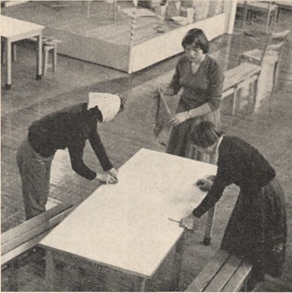
Festforberedelser på Sønderlandsskolen.