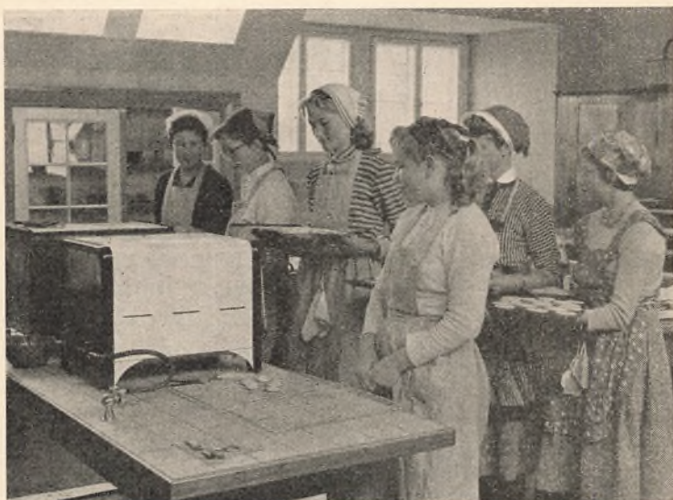
Piger fra IV. eksamensmellem arbejder i skolekøkkenet i Danmarksgades skole.