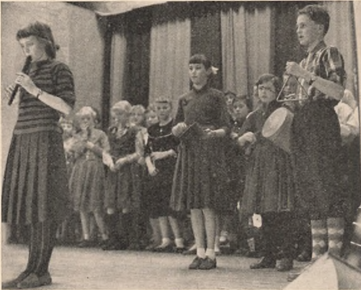
Blokfløjteorkestret underholder ved skolefesten for borgerskolens elever.