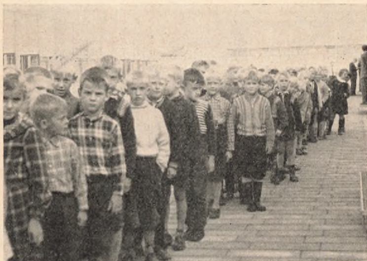
Eleverne stiller op i skolegården.