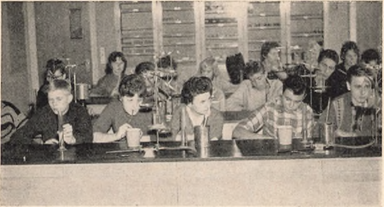
Fysiktime i Sønderlandsskolen.