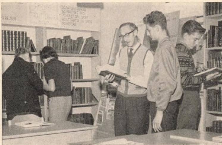
Fra skolelæsestuen i Danmarksgades skole.