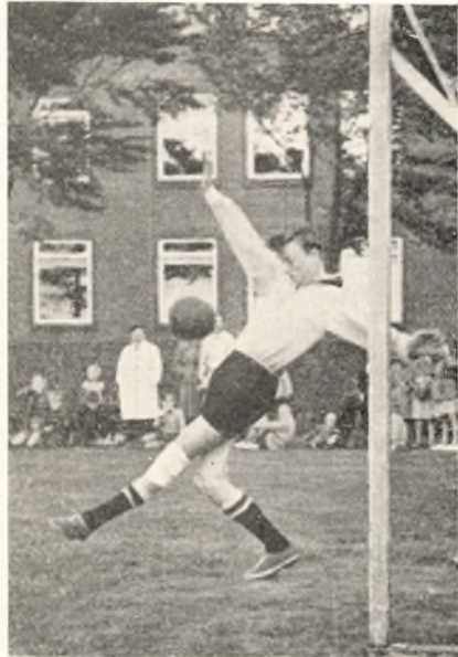
Situationer fra idrætsugen 1952.