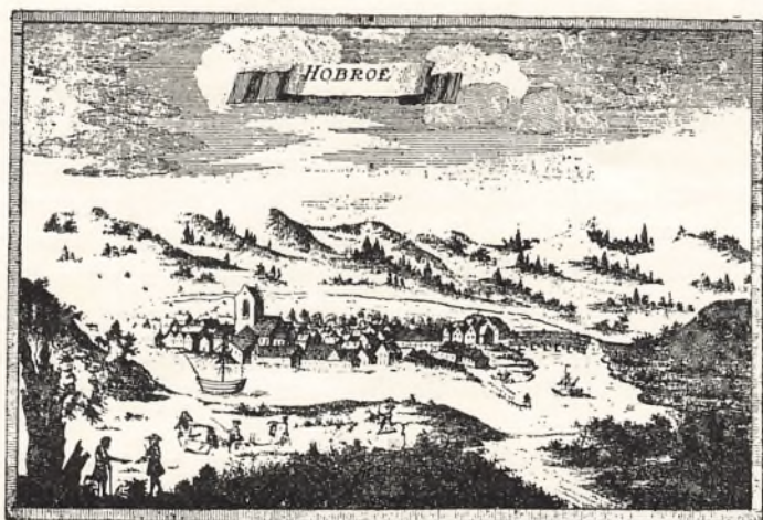
Hobro 1767. Efter „Danske Atlas“.

Hobro hørte i 18. Aarh. til Landets mindste Købstæder og — fattigste.