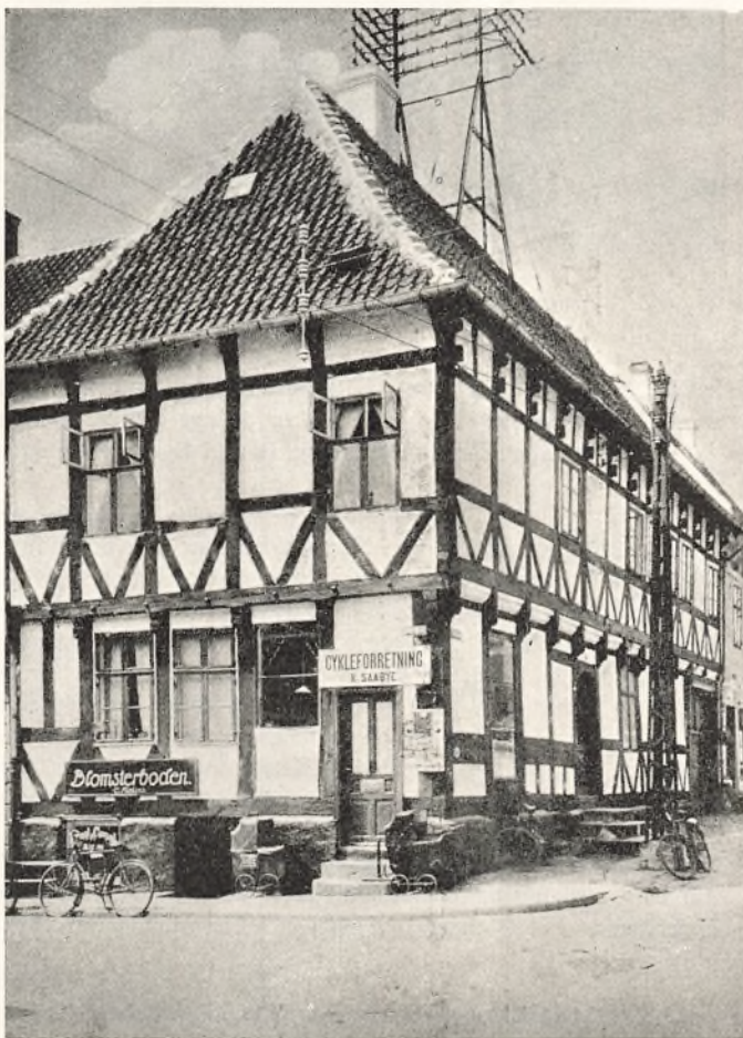
Bygning fra 1681. Brugt som Borgerskole 1816–1876. Nu i privat Eje.

Man vedtog at ophæve disse to Skoler og at oprette en „almindelig Borgerskole“ fælles for alle de undervisningspligtige Børn i Byen, som ikke blev undervist privat. — Derefter købte man