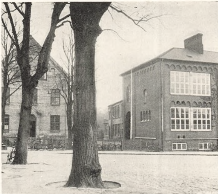
Borger-skolen. Bygningen til venstre er fra 1875, de andre Bygninger fra Aarene 1904—11.

Borger- og Realskolen har Fællesundervisning for Drengene og Piger og optager de Børn, der i 10-Aars Alderen findes modne dertil, og som ikke ønskes optagne i Almenskolen. — Undervisningen i Borger-skolen fører gennem 4 etaarige Klasser til den ved Ministeriets Bekendtgørelse af 30. Januar 1899 an-