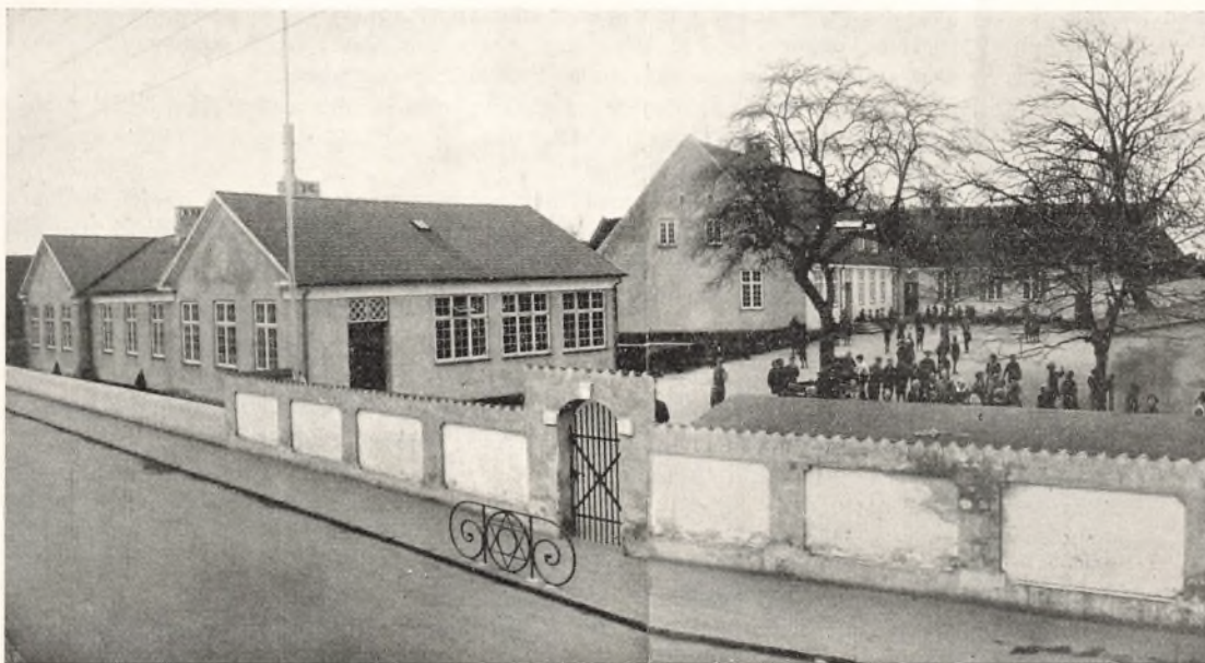
Skolen ved Volden. Tidligere Amtssygehus. Indrettet til Skole i 1925. Bygningen til venstre er fra 1891, Bygningerne i Baggrunden fra 1872.

I 1915 blev der taget fat paa at faa dette Forhold rettet. Almenskolen kom til at hedde Borgerskolen. Alle dens Klasser kom til at gaa i Skole om Morgenene ligesom Mellem- og Realskolens. Derved blev bl. a. Uvæsenet med Bypladser nogenlunde uskadeliggjort, og Børnene fik begyndt med Skolearbejdet, mens de var friske. Arbejdet blev samlet mere om Dansk, Regning og Skrivning, og der blev indført ensartede og planmæssige Hjælpe midler til disse Fag. I 1919 indførtes Engelsk som frivilligt Fag for de Elever, som havde Lyst og Evne til at modtage lidt Sprogundervisning.