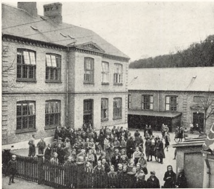
Mellem- og Realskolen. Bygningen til venstre er fra 1887, Gymnastiksalen fra 1890.

Under Indtryk af, at Forandringen alligevel skulde gøres i Løbet af faa Aar, fordi alm. Forberedelseksamen ikke vilde blive opretholdt ved Siden af Realeksamen, besluttede man i 1905 at gaa over til den nye Ordning: