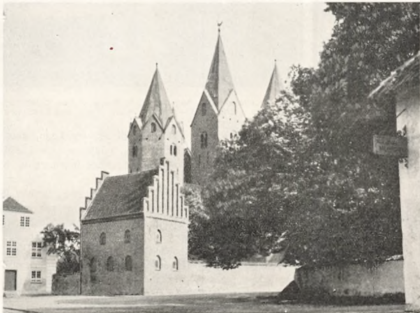
Bygningen i Forgrunden er fra 15. Aarhundrede. Rektorbolig til 1739, Fattigskole til 1816, derefter Fattighus. Siden 1877 Ligkapel.

— — Der bestemmes endvidere: „Skriveskoler, som man dennem kal-