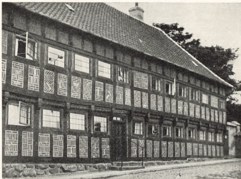
Bygning fra 17. Aarhundrede. Fattigskole, Almueskole, Friskole 1837—1876. Pogeskole 1881—87. Endnu i Kommunens Eje.

den store Bindingsværksbygning i Lindegade over for Apoteket og indrettede deri tre rummelige Skolestuer. — Som Lærere ansattes: