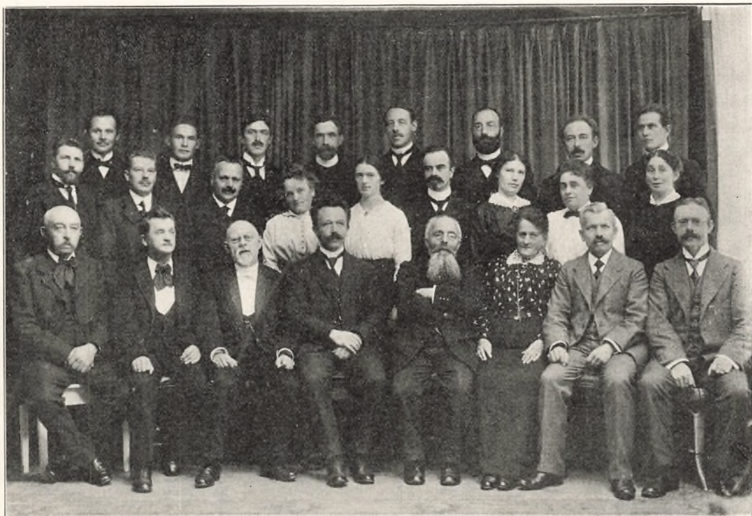
Fra Kalundborg Skolevæsen 1915.

Kalundborg Kommunes Udgift til Skolevæsenet, Renter og Afdrag paa Laan medregnet, var i 1888: 19024,09 Kr., i 1898: 25361,20 Kr., i 1907—08: 49258,07 Kr., i 1917—18: 79324,55 Kr., i 1927—28: 137980,92 Kr. og i 1932—33: 143077,30 Kr. Dertil maa lægges Landdistriktets Bidrag, som i 1932—33 var 7265,88 Kr. Tilskuddet fra Skolefond og Stat til Lønninger m. m. var samme Aar 62033,32 Kr.