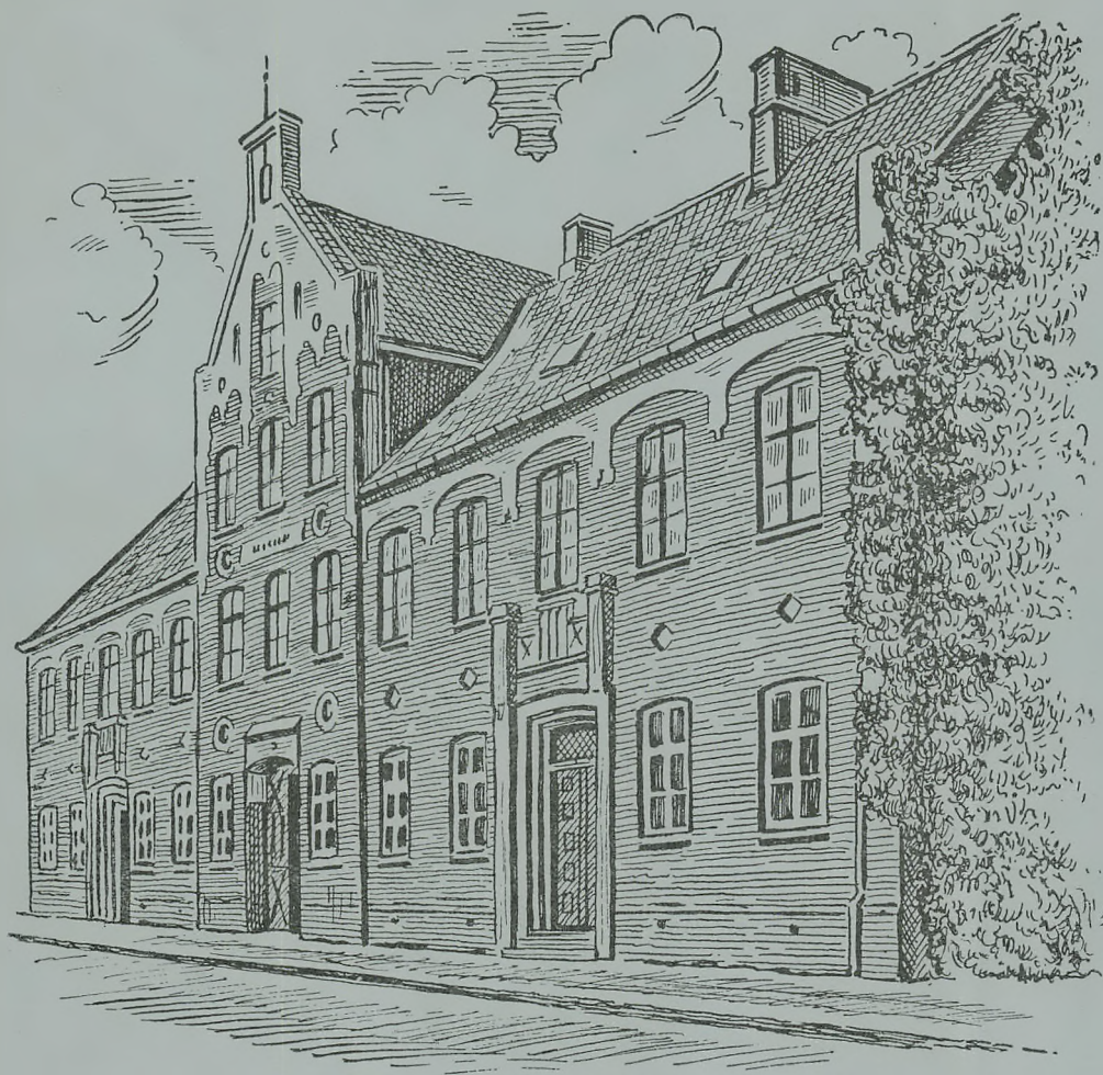
SKOLEN I ALLEGADE