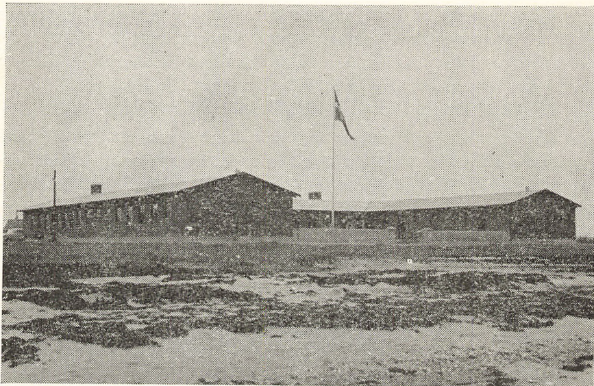
Den nye feriekoloni »Horsnæsbo« set fra strandbredden

at foreningen ialt rådede over ca. 90.000 kr. Det manglende beløb skaffedes til veje ved optagelse af et lån i Landbosparekassen på 130.000 kr. med Horsens kommune som garant. Samtlige udgifter, herunder også til nyt inventar, beløb sig til 219.293,80 kr.