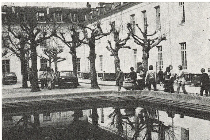
2a på Centre International d'Etudes Pédagogiques, Sèvres.

24.—26. februar: Skolekomedie. — Elever fra 2g opførte