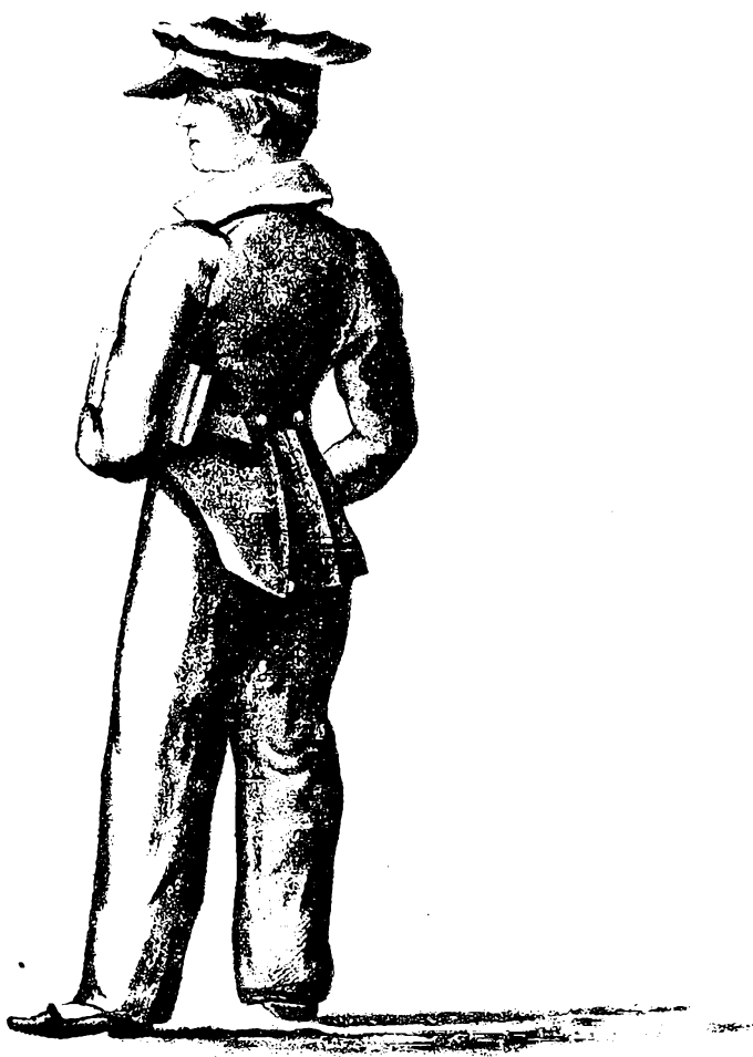
Den förste soranske Elevdragt fra Indvielseshöjtiden 1827.