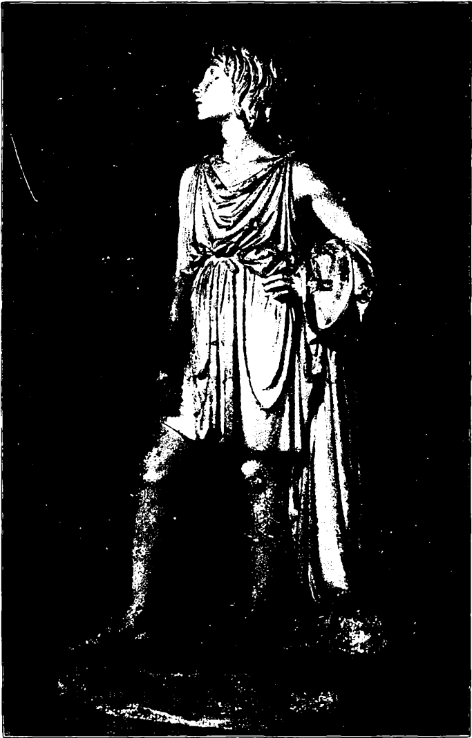
Den lyttende Yngling fra Thorvaldsens Johannes-Gruppe. Skænket Ordrup Gymnasium af en Kreds af Forældre til Skolens 40 Aars Fødselsdag d. 3—11—1913.