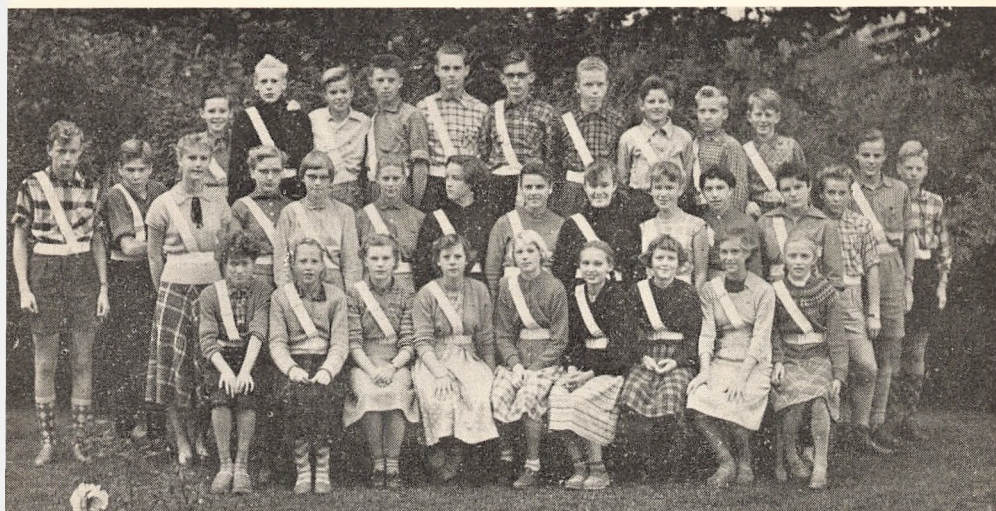
Den første skolepatrulje