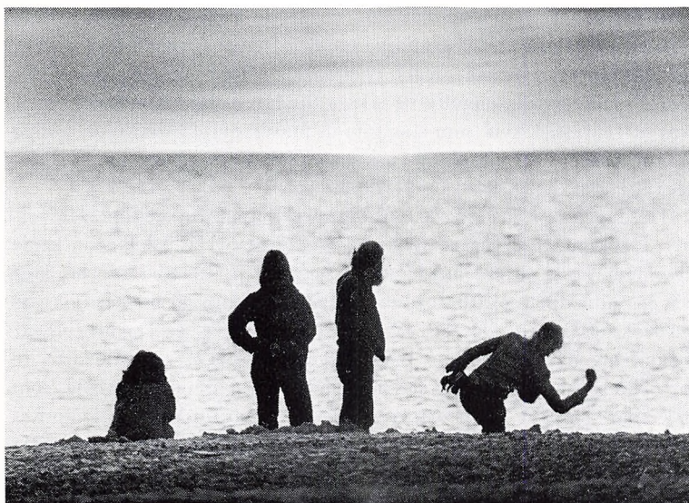
Havet og menneskene.

stande, end at de var til at overse. Og dog fik man et levende indtryk af, hvordan folk på egnen har levet i »gamle dage«.