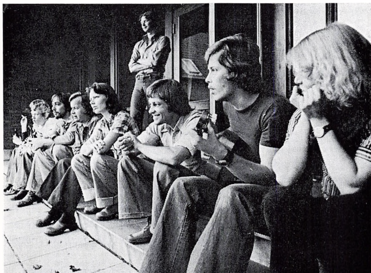
Pause under generalforsamlingen.

Vestjyllands Højskole, søndag den 25. september 1977