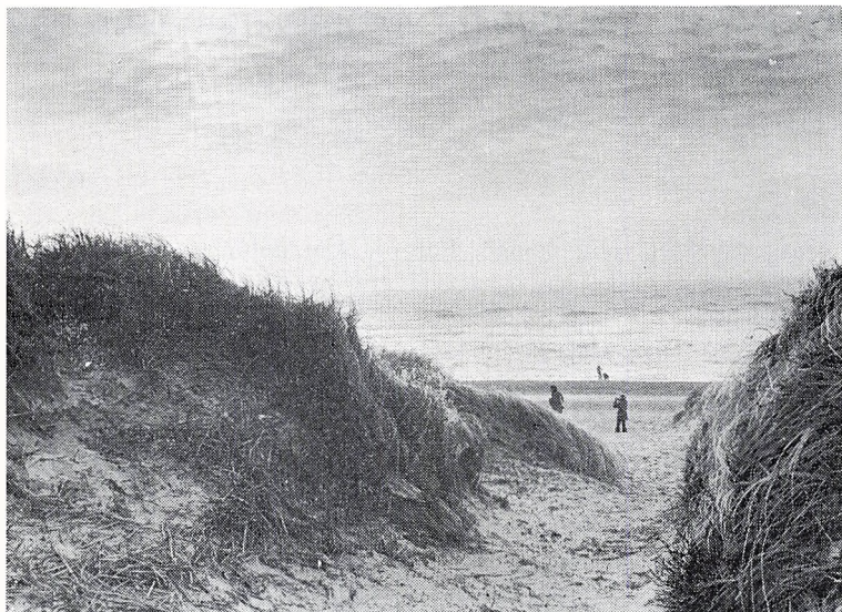
Hav og klit.

2. Ringkøbing amtsråd vil ikke give støtte til Team-teatret. Huset i Tarm skal lukkes. Vejle avis regner med snart at måtte lukke. Alle de grupper, vi snakkede med, havde pengeproblemer. De havde ikke statens, amternes eller kommunernes velsignelse. Måske lige bortset fra forsamlingshuset på landet.