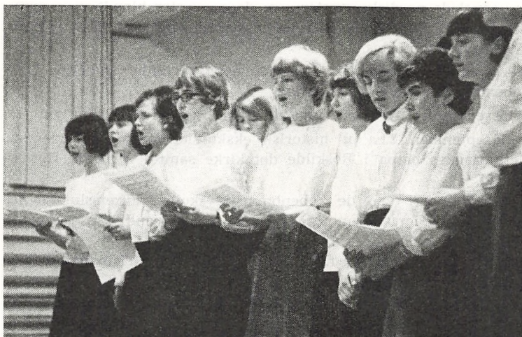
Fra koncerten april 1965