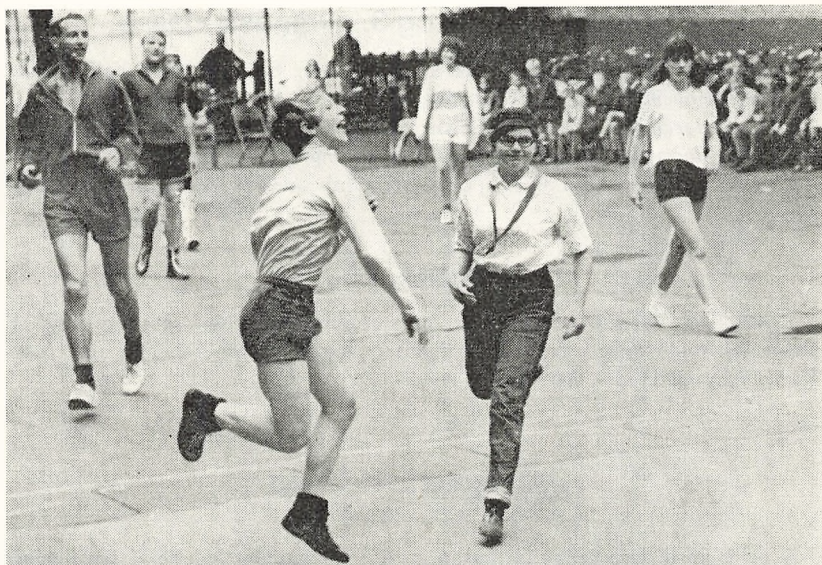
Fra håndboldkampen mellem lærere og elever i 2 r.

31. august. 3 h udflugt til Brede med rektor, hvor Nationalmuseets udstilling om Grønland besøgte.